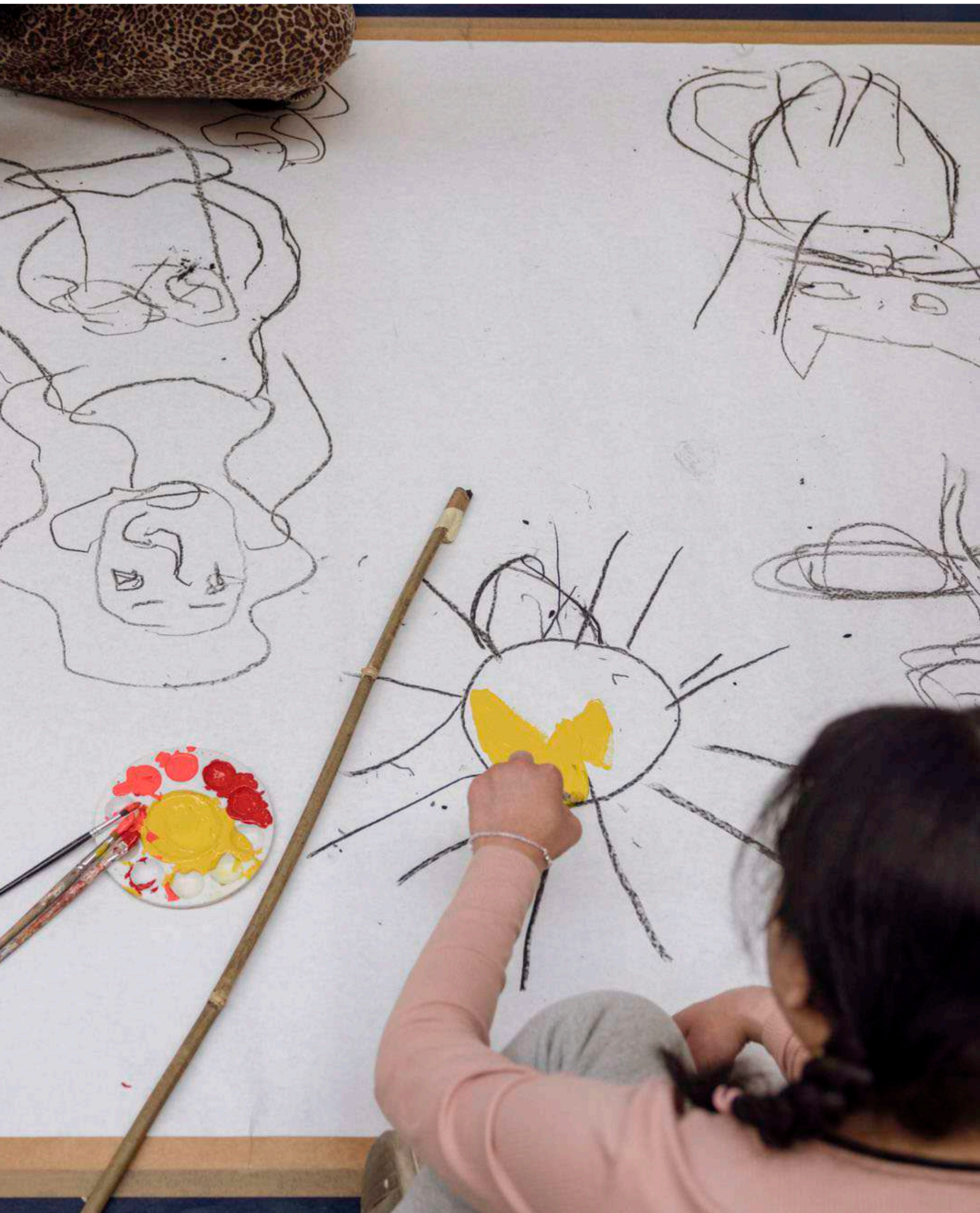
e. Flere af kunstnerne gav udtryk for, at det var sjovt at lave noget sammen i stedet for hver for sig, som de mere gør til hverdag.