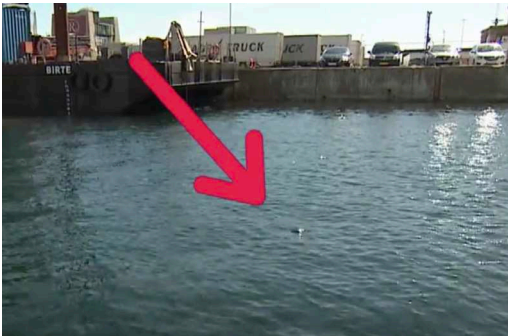
Vandmelonen / svømmeren ligger i overfladen