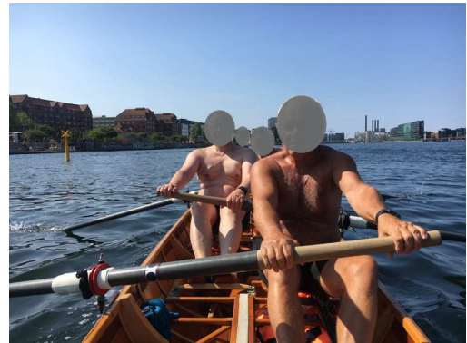
Midt i åretaget, hvor båden opnår en hastighed på 8-10 km/t