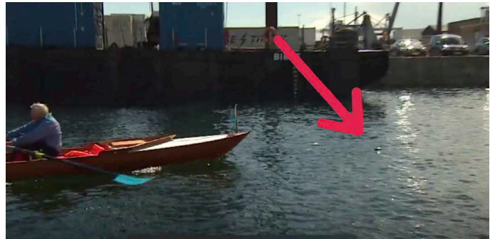
Bådens styrmand har i praksis INGEN mulighed for at se svømmeren

Ovenstående eksempler er fra en robåd, hvor der i hver båd er en certificeret styrmand.