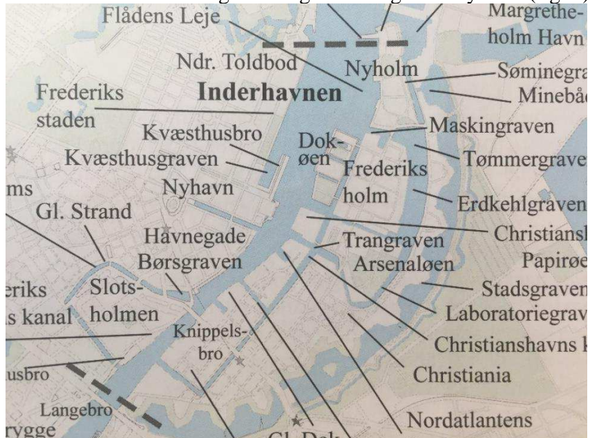
Fig. 1 Oversigt over Inderhavnen afgrænsning

Inderhavnen strækker sig fra Langebro til og med Nyholm (fig. 1):