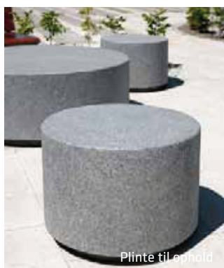
Plinte til ophold

Majporten har med sin beliggenhed potentiale til at blive et lokalt mødested, hvor også forbigående cyklister fra den grønne cykelrute kan snuppe en pause. Der skal være mulighed for både aktivitet og hvile. Samtidig kan en lommepark på dette sted bidrage til, at bydelen bliver grønnere. Et vandtema med lokal afledning af regnvand kunne gøre Majporten til noget særligt.