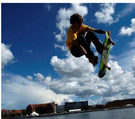
Skateropvisning ved Kulturhavn 2005

Idéen er, at festivalen finder sted hvert år med start fredag primo august til søndagen efter, i alt 10 dage.