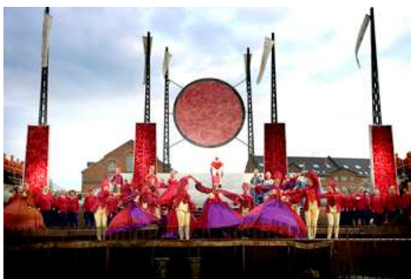
"Den Lille Havfrue" i Københavns Havn 2005