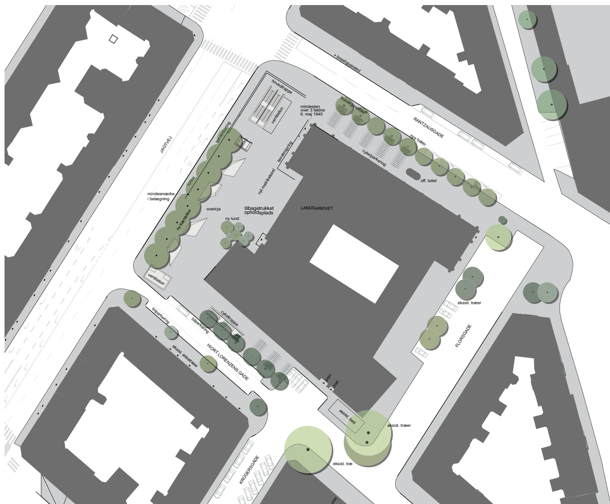
Dispositionsplanen, vedtaget af Borgerrepræsentationen i foråret 2011, som danner grundlag for lokalplanforslaget. Dispositionsplanen er også udgangspunktet for den endelige bearbejdning og projektering af pladsen. Det endelige projekt fremlægges til politisk godkendelse 2012/2013." (Illustration, Metroselskabet)