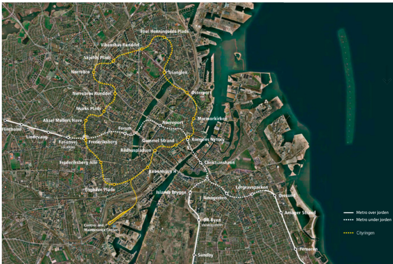
Oversigt over Cityringens linjeføring