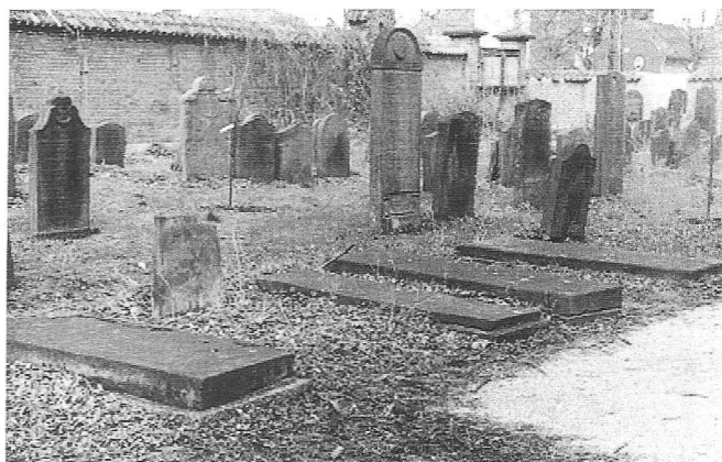
De liggende sten på den portugisiske begravelsesplads

I 1855 erhvervede repræsentanterne på en auktion et stykke jord på ca. 1.100 m 2 til en ny udvidelse, selv om det kunne være en årrække, før der blev brug for den. Tilladelsen til at anvende jorden til begravelser måtte passere Sundhedskommissionen og Justitsministeriet, før den i 1873 var på plads. Det blev den sidste udvidelse.