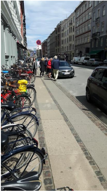
Cykler på Ndr. Frihavnsgade