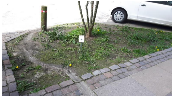
Byens mindste "grønne byrum"