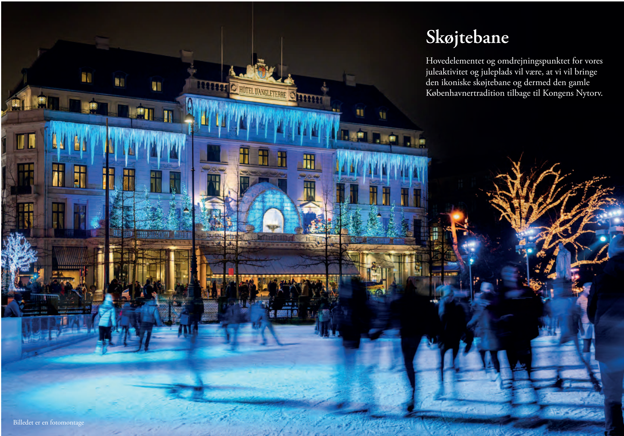
Billedet er en fotomontage

Hovedelementet og omdrejningspunktet for vores juleaktivitet og juleplads vil være, at vi vil bringe den ikoniske skøjtebane og dermed den gamle Københavnertradition tilbage til Kongens Nytorv.