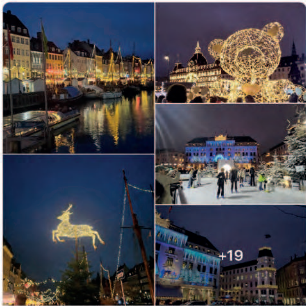
Ida Andersen • Copenhagen 17. december 2023 Skønne København med lys og den flotteste himmel i lilla skær