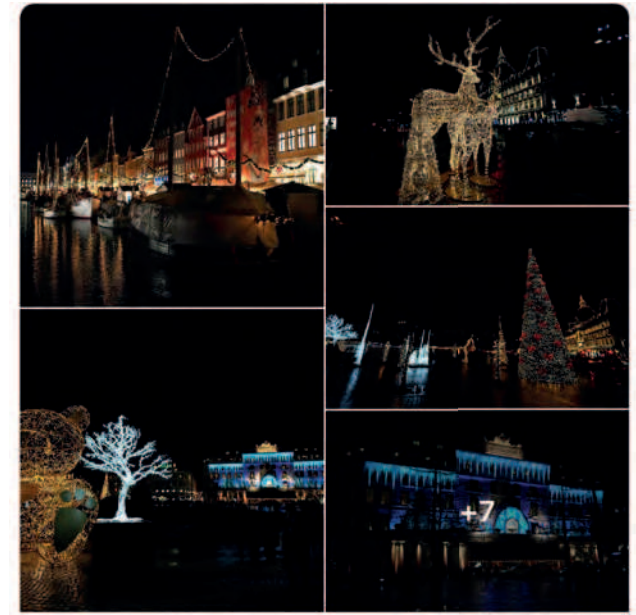
Anders Holbæk • Copenhagen 22. december 2023 Copenhagen Christmas impressions December 2023