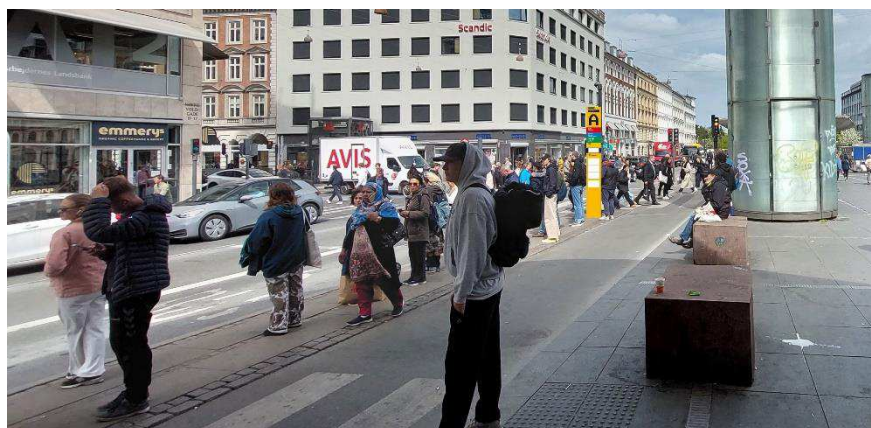
Billede 1: Principiel illustration af stoppested A på Nørre Voldgade.