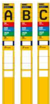
Principiel illustration af de fire stoppestedstandere. Stander D afviger fra de øvrige stoppestedstandere jf. nedenstående beskrivelse, billede 2.

Forsøget består i ændringer af fire stoppestedstandere, som angivet på Bilag 1 – oversigtskort, for en periode på ti måneder. Tre af stoppestedstanderne forhøjes ved at tilføje en blok med henholdsvis A, B, C på standerne, hvorved de opnår en højde på 330 cm. Dette er, grundet standeren konstruktion, maksimalhøjde. Herudover folieres selve standeren gul (RAL 2028).