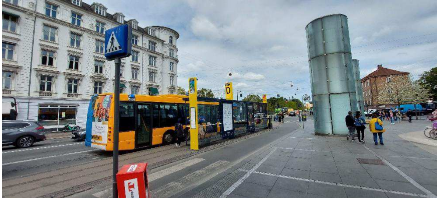
Billede 2: Principl illustration af stoppested D på Nørre Voldgade.

Stoppestedsstander D monteres som nyt element på eksisterende læskur på Nørre Voldgade, hertil folieres selve busstopstanderen gul (RAL 2028).