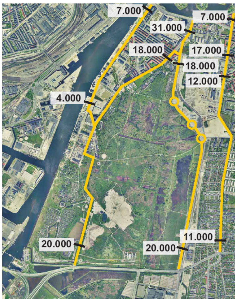
Figur 3 - Trafikmængder pr. døgn, 2015, inkl. fysiske ændringer