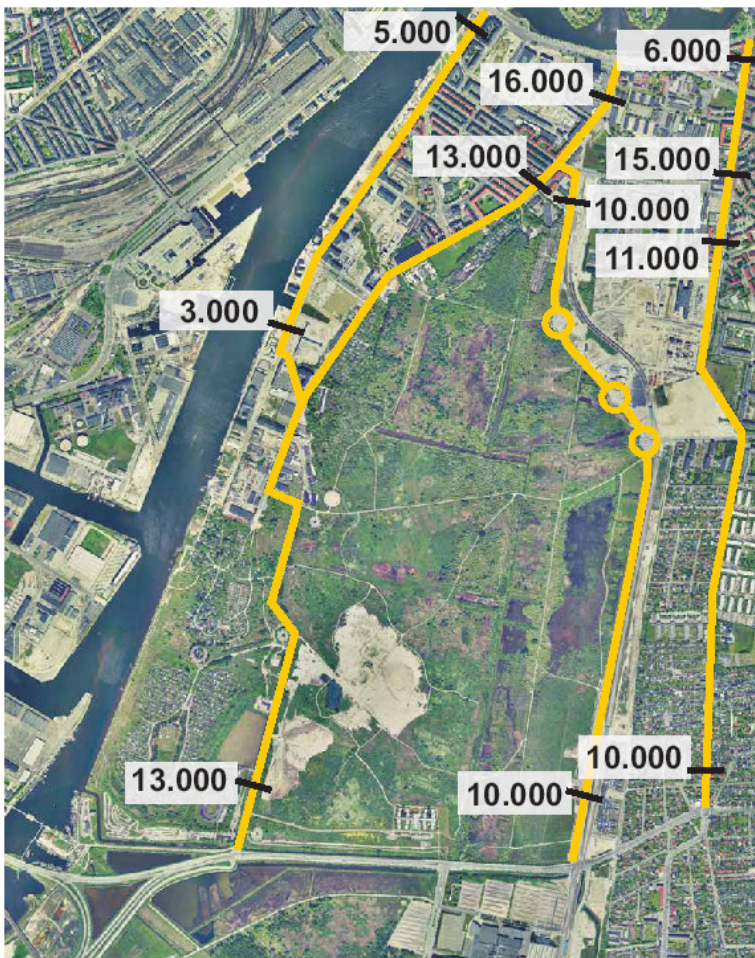
Figur 1 - Trafikmængder pr. døgn, 2005

Det følgende kort viser døgntrafikken på hhv. Islands Brygge, Artillerivej/Lossepladsvej, Ørestads Boulevard og Amager Fælledvej/Røde Mellemvej.