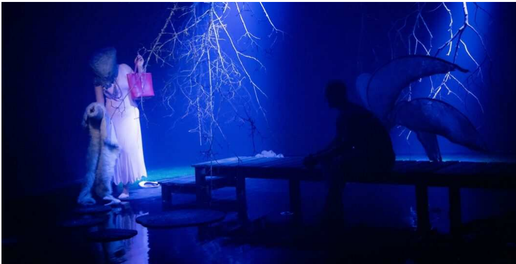
The Swamp, Cassandra Production og Holstebro Dansekompagni.