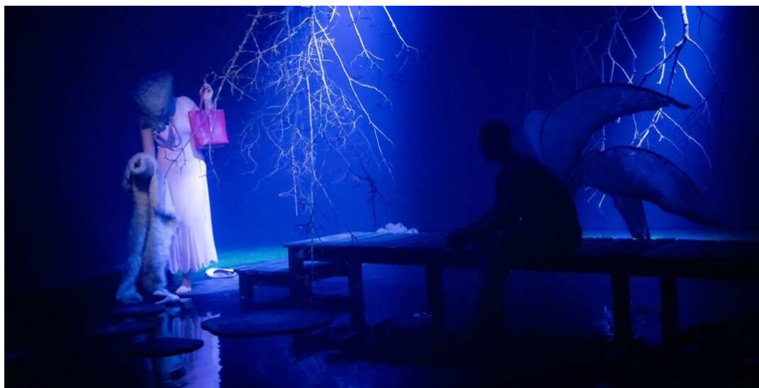
The Swamp, Cassandra Production og Holstebro Dansekompagni.