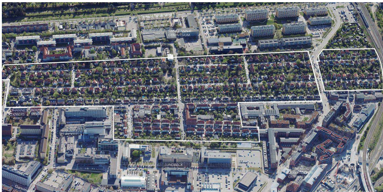
Området set mod øst. Lokalplanområdet er indtegnat med hvid linje, og de vigtigste gader og bygninger er navngivet.

områdets egenart. Samtidig skal lokalplanen fastlægge bebyggelsesregulerende bestemmelser for nybyggeri.