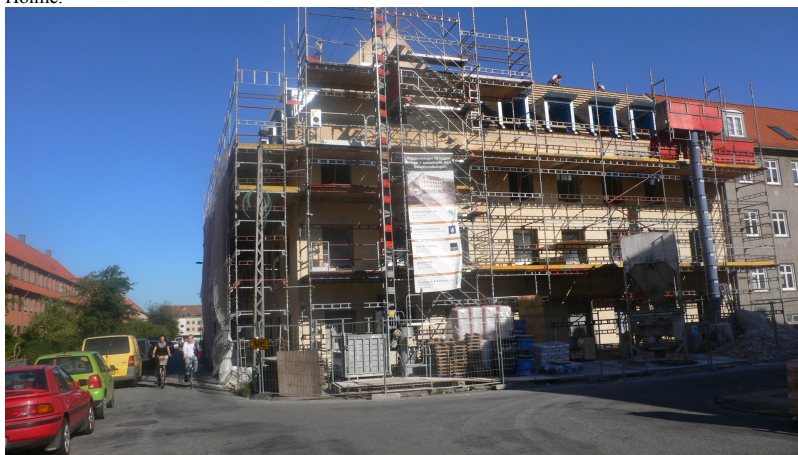
Billede af bygningen under den nuværende byggeproces.

Frist for høringen er 2. oktober 2009 . Det betyder, at høringssvar inden da skal indsendes på DUHandicapogpsykiatri@sof.kk.dk eller til Drifts- og udviklingskontoret for Handicap og Psykiatri, Bernstorffsgade 17, 4. sal, 1592 København V. Derudover kan høringssvar afleveres til personalet på Holme.