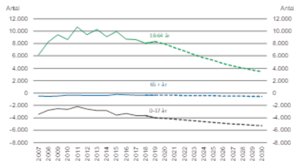
Nettotilflytning efter alder

Især unge fra både ind- og udland flytter til København. En stor del stifter familie i byen, nogle familier flytter ud af byen, og andre bliver boende. Det er typisk unge enlige, der flytter til København, mens en stor del af dem, der flytter fra byen, er familier på to eller flere personer.