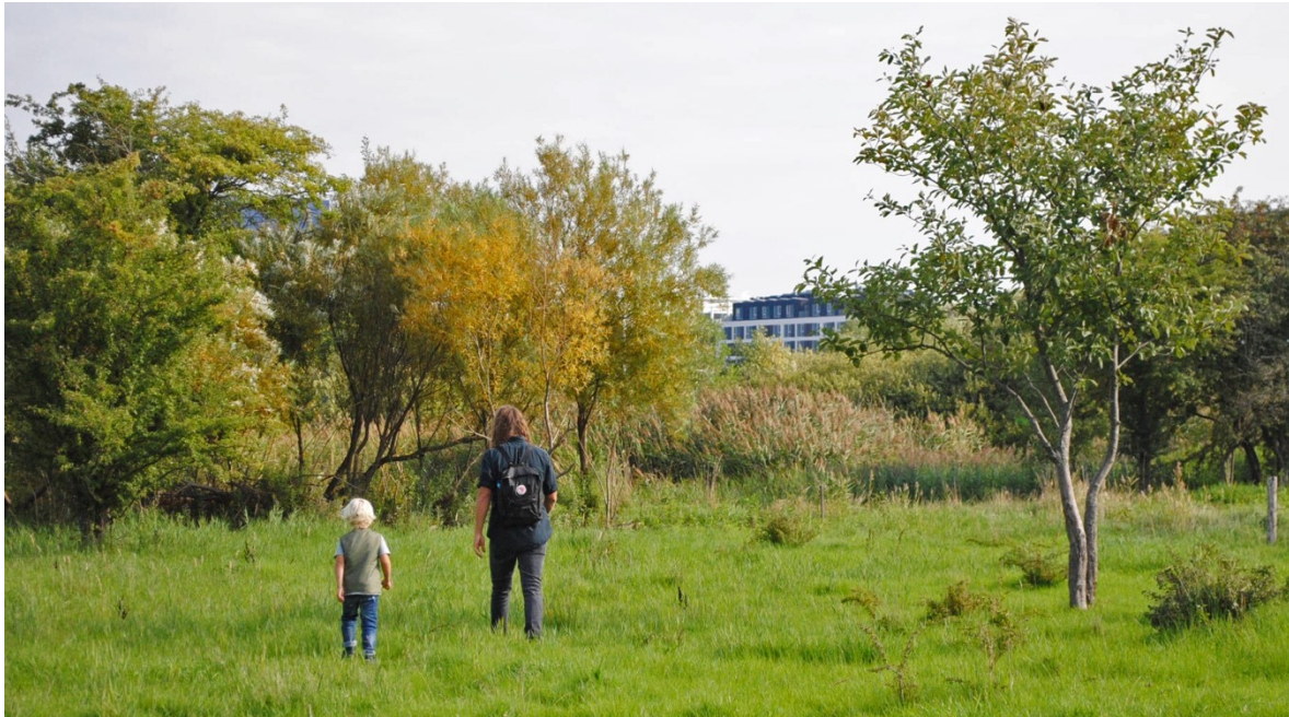
Et af de områder, der kan blive berørt af Havnetunnellen, er Amager Fælled

Arbejdet med at udarbejde et katalog med lokale opmærksomhedspunkter ved anlæggelse af havnetunnel er påbegyndt. Der er indsamlet baggrundsmateriale om østlig ringvej og foretaget kvalitative interviews med repræsentanter for lokale virksomheder i Amager Vest. Der mangler dog flere input fra borgerne på Amager inden kataloget kan offentliggøres. Undersøgelsen af den nye bydel Lynetteholmen forventes også at få indflydelse på de fremtidige aktiviteter under indsatsområdet 'Havnetunnel/Østlig Ringvej'.