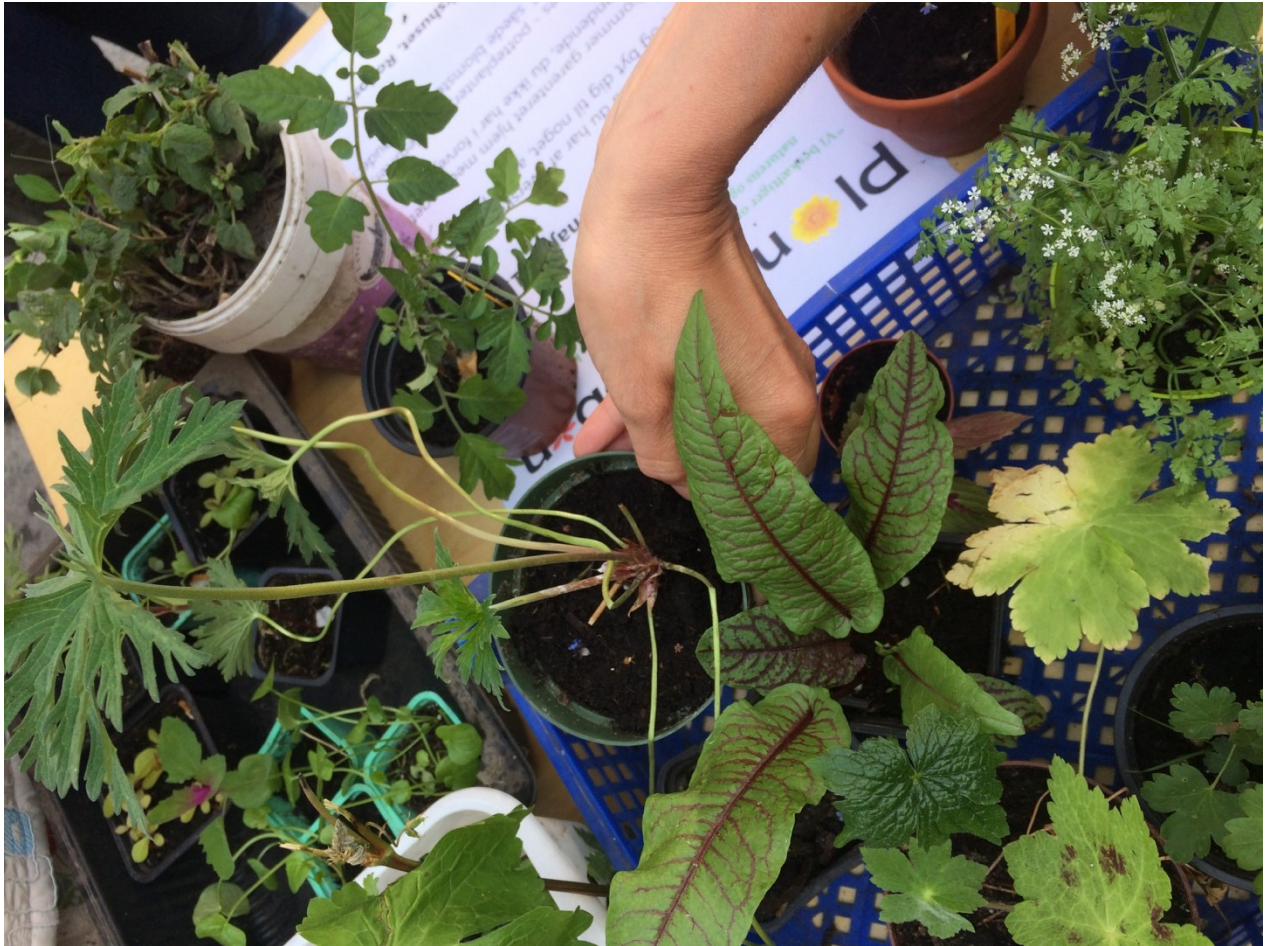
Fra Plantebyttedag i Bibliotekshuset på Rhodosvej