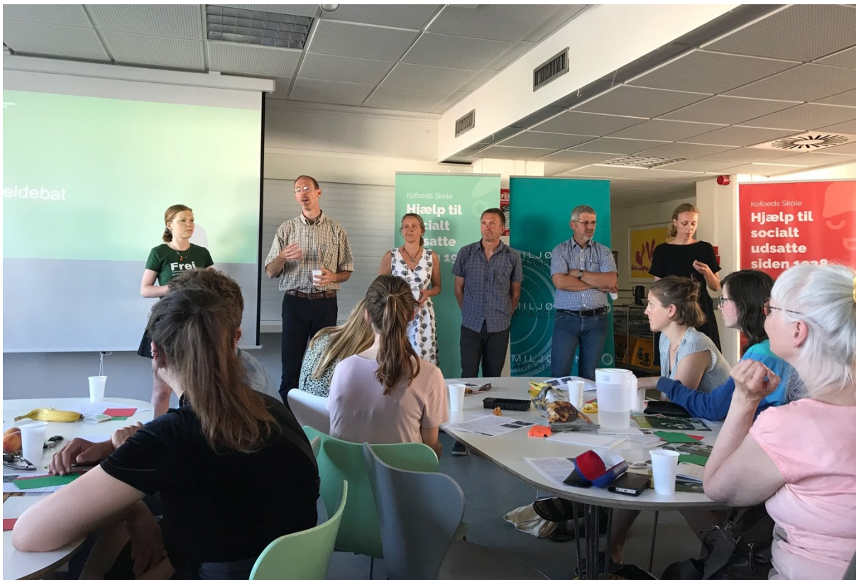
Oplægsholderne ifm. debatarrangementet om bier og biodiversitet på Kofoeds Skole

Den 7. juni samarbejdede Miljøpunkt Amager og Kofoeds Skole med Tænk tanken Frej om at holde et debatarrangement for at blive klogere på årsagerne til den enorme bi-dødelighed og hvordan vi i fællesskab kan sikre bierne og biodiversiteten. 140 deltagere mødte op til et vellykket debatarrangement med indlæg fra fem eksperter fra hhv. KU, Dansk Naturfredningsforening, Danmarks Biavlerforening, Vilde Bier i Danmark og Landbrug og Fødevarer.