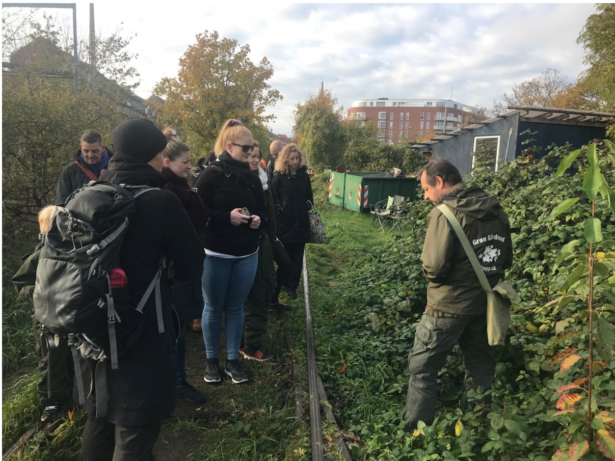
Guidet tur langs Amagerbanen

De guidede ture får altid stor opmærksomhed og bliver hurtigt fyldt op med deltagere. Det er et interessant værktøj til at italesætte de naturkvaliteter der findes i byen og give dem en værdi for borgerne, der rækker ud over den rekreative.