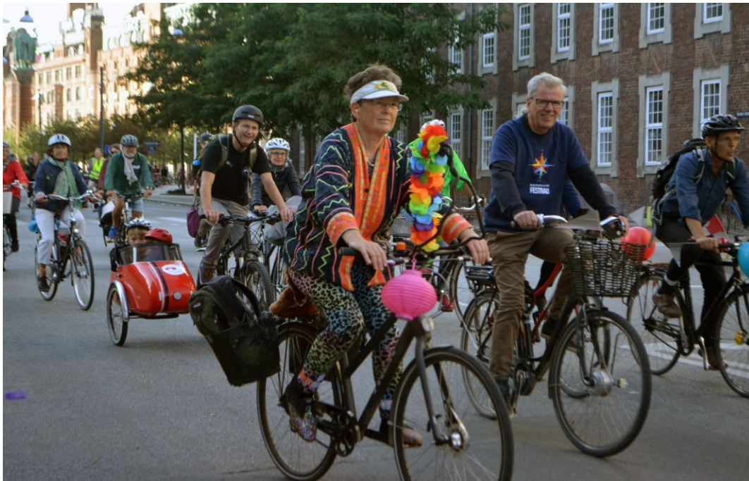
Cykelparaden under Bike Pride

Miljøpunkt Amager var medarrangør på Bike Pride som var en cykelfest og en cykelparade i forbindelse med åbning af Kulturhavn Festival 2018. Miljøpunkt Amager deltog i planlægningen og havde en bod på cykelfestpladsen hvor deltagerne kunne pimpe deres cykel med genbrugsmaterialer.