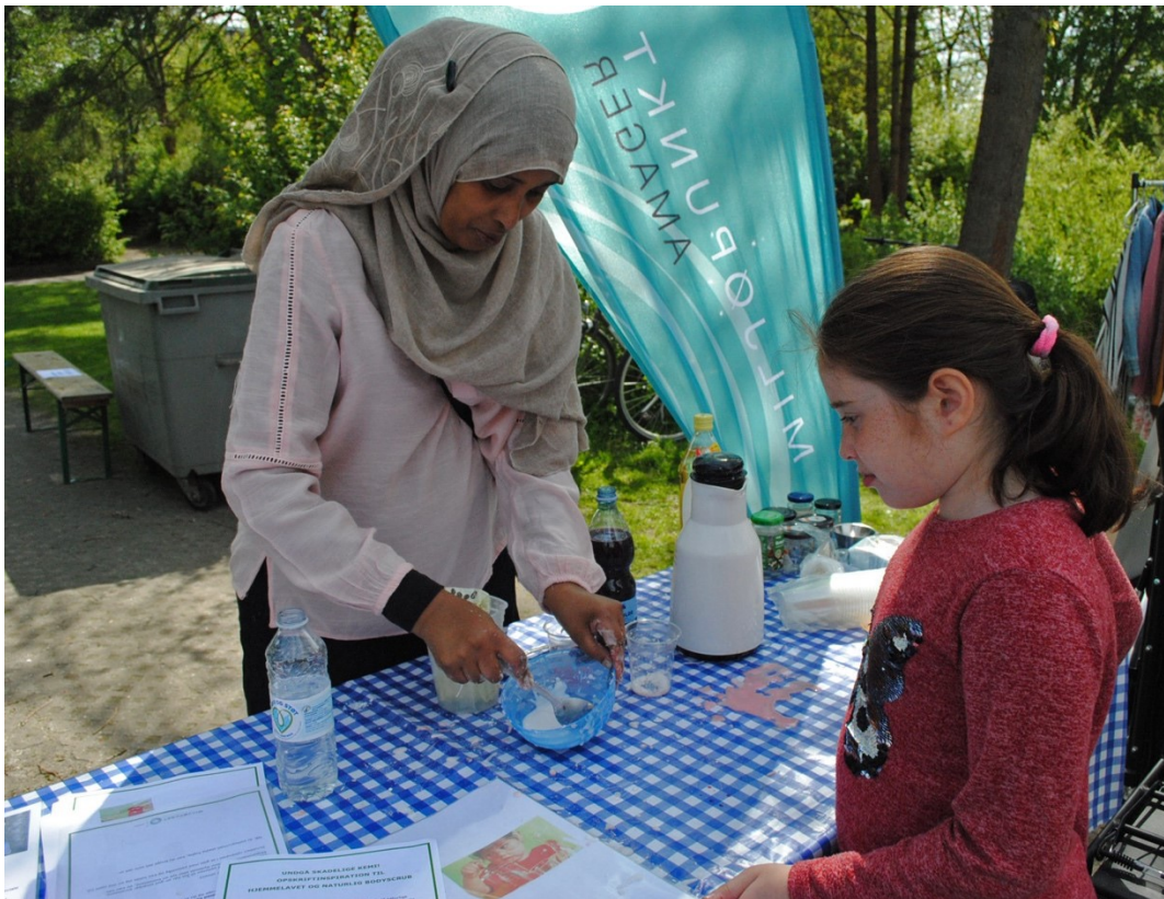
Fokus på kemi i hverdagsprodukter til Urbanfestivalen

I Amager Vest deltog Miljøpunkt Amager i Urbanfestivalen den 5. maj i Urbanplanen. Det var en festlig dag med mange sjove og spændende aktiviteter. Vi havde valgt at fokusere på hvilke kemikalier, der er skjult i hverdagsprodukter til pleje og leg - og hvordan man kan undgå dem. 80 Børn (og voksne) lavede deres egen bodyscrub ud af kaffegrums og olie, samt lege-slim ud af kartoffelmel.