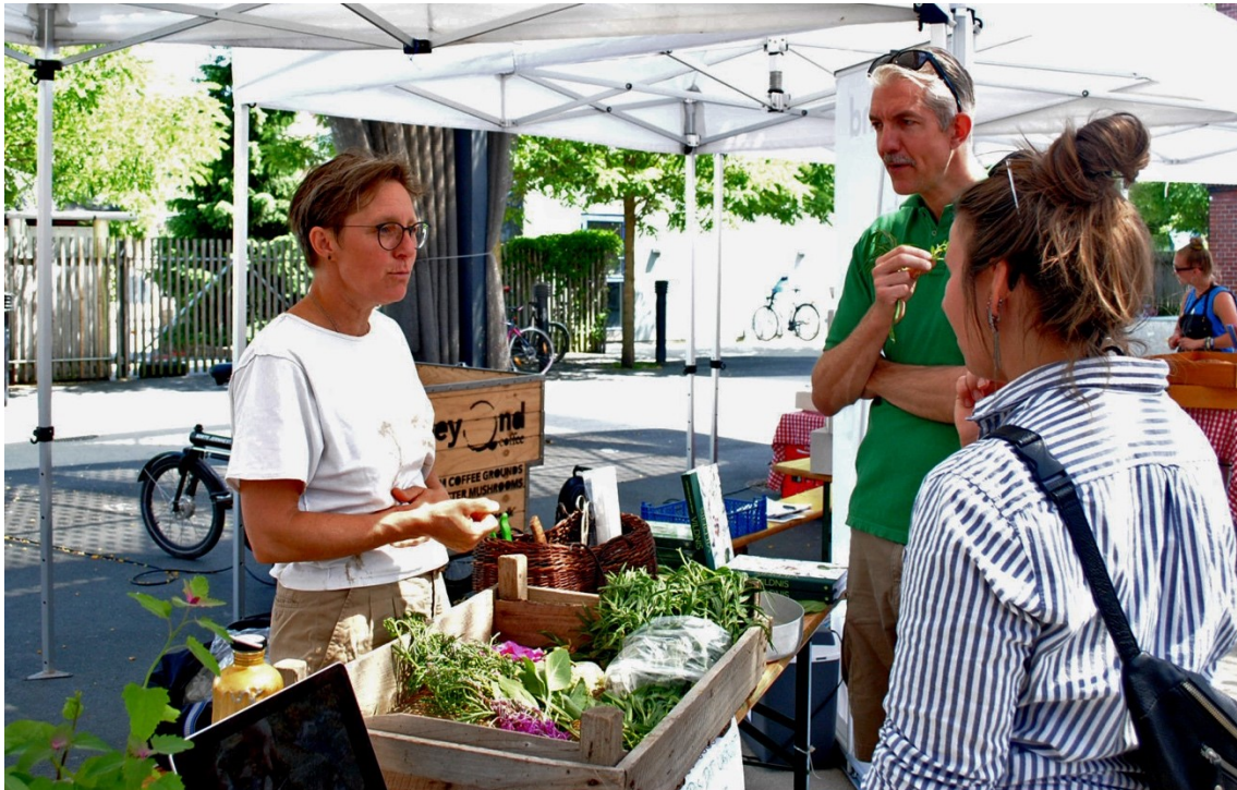
Lokal mad på Musiktorvet

Arrangementet var en delvis succes. I løbet af dagen var der ca. 100 besøgende og om aftenen havde 41 købt billet til fællesspisningen. Vi er godt tilfredse med antallet af gæster til fællesspisningen, da det endnu er en ret ny ting at gøre på et sted som Musiktorvet. Antallet af gæster i løbet af dagen er dog noget under hvad vi havde forventet. Der var dog 30 grader, Dragør Marked og feriestemning, så måske vi ville have haft bedre held med at holde det i efteråret. Vi havde ellers gjort en større indsats for at reklamere for dagen. I måneden op til arrangementet havde vi kørt en betalt Facebook-kampagne, og i samme uge havde vi en annonce i Amagerbladet og en artikel i deres weekendavis. Vi har også hængt plakater op rundt om i byen og delt begivenheden bredt på de sociale medier. En idé til en anden gang kunne være at lægge det sammen med et andet større event, som Amager Majfest eller Amager klima- og demokratifestival.