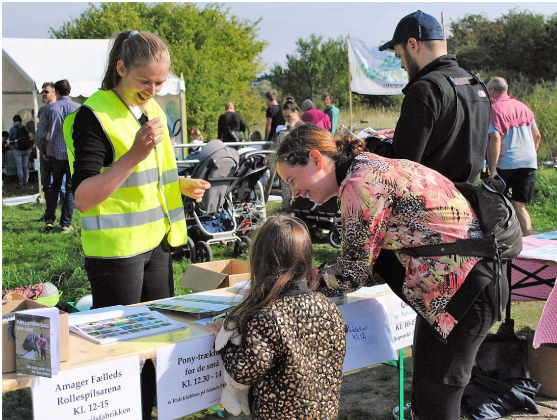
Miljøpunkt Amagers stand på Fælledens Dag

Fælledens Dag blev afholdt i samarbejde med Danmarks Naturfredningsforening, Københavns Kogræsserlaug, Amager Fælleds Rollespilsarena, Rideklubben Islands Brygge og lokale foreninger, som bruger Fælleden. Arrangementet var støttet af Amager Vest Lokaludvalg og Københavns Kommune Kultur- og Fritidsforvaltningen. På dagen blev der uddelt guiden 'Smag Amager Fælled', der blev trykt med midler fra Friluftsrådet.