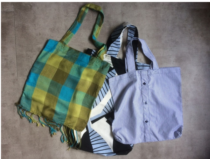
Stofposer der er syet af frivillige ifm. projektet 'Plastikpose-frit Amager'

Miljøpunktet tog sig blandt andet af kommunikationsopgaver såsom promovring på sociale medier og udarbejdelse af flyers og plakater. 700 flyers blev omdelt og fem forskellige plakater udarbejdet og der kom fem artikler i Ama´røsten og Amagerbladet. Miljøpunktet var også med til at etablere samarbejder med frivillige og Miljøpunkt Amagers netværk og andre aktører i lokalområdet. Projektet fik økonomisk støtte af lokaludvalgene og Områdefornyelsen Sundby til indkøb af stempler, symaskiner m.m.