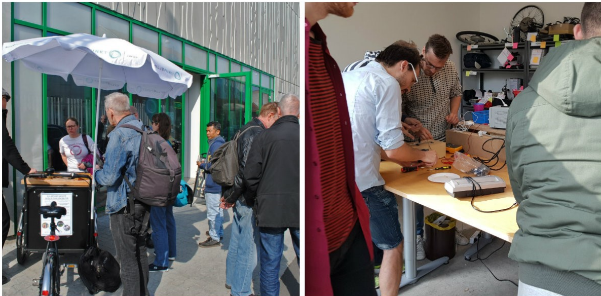
Åbningsreception af Elektronikværkstedet og elektronik workshop med frivillige

Efter åbningen af Elektronikværkstedet er der blevet afholdt en række reparationsworkshops. Alle afholdt af frivillige selv. Nogle workshops har kun været for frivillige, hvor frivillige har lært og undervist hinanden, mens de fleste andre workshops har været åben for alle. Formålet har været at dele viden og lære alle interesserede om elektronik og reparationer og dermed give elektronik længere levetid inden det ender som affald. Der er blevet afholdt fem workshops, hvor der hver gang har været mellem 4-10 deltagere udover de frivillige, der har stået for workshoppen.