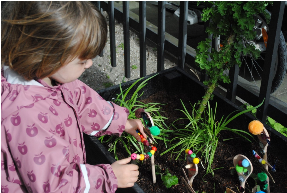
Plantekassedag i Kvarterhuset

Den 24. april var der en udendørs plantekassedag sammen med Børnebiblioteket Sundby. Børn kunne komme og lave kreative planteskilte og være med til at plante nye blomster og krydderurter i Kvarterhusets plantekasser. TagTomat leverede planterne og var ligeledes til stede og hjalp børnene med at plante planterne i kasserne. Det var et succesfuldt arrangement hvor både de ca. 30 børn, og deres forældre var begejstrede for at forene kreative sysler med læring om planter.