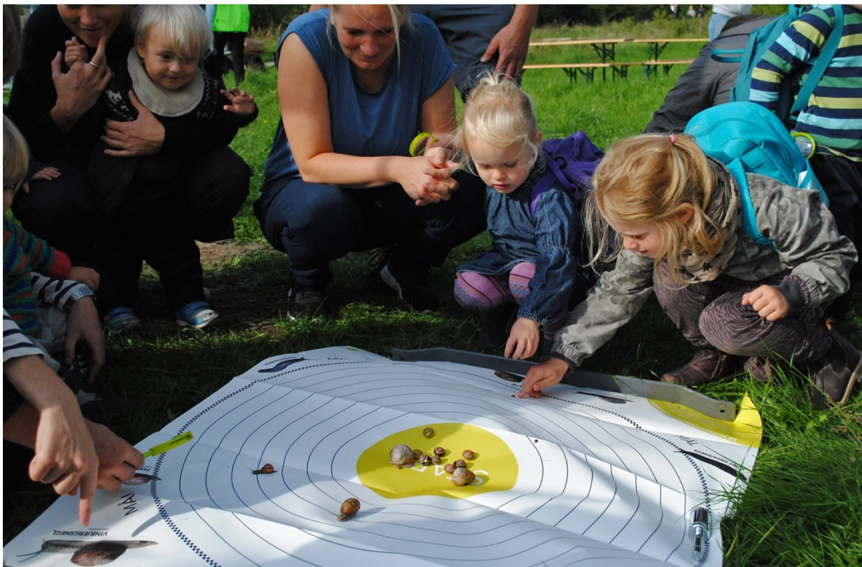
Børn følger spændt med i snegleræset til Fælledens Dag

Det lykkedes i høj grad Miljøpunkt Amager at realisere målsætningerne for indsatsen. Miljøpunkt Amager stod til rådighed i forhold til at understøtte Amager Vest Lokaludvalgs arbejde, hvilket dog var en indsats lokaludvalget selv i høj grad var i stand til at løfte. Der blev afholdt tre vintergåture og fire guidede ture til Fælledens Dag. Fælledens Dag var igen en succes med ca. 1500 deltagere i aktiviteterne.