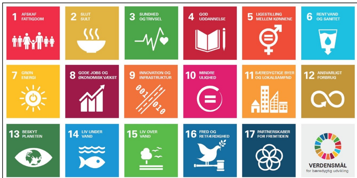
FN's 17 Verdensmål for bæredygtig udvikling

Hos Miljøpunkt Amager er alle indsatser relateret til FN's verdensmål for bæredygtig udvikling. Under hvert enkelt indsatsområde vil vi nævne det/de verdensmål som aktiviteterne/indsatsområdet understøtter. Vi ser arbejdet med at understøtte verdensmålene og udbrede kendskabet til dem som en vigtig opgave for miljøpunktet. Verdensmålene er relevante for os alle og miljøpunktet vil gerne være med til at gøre verdensmål til hverdagsmål, hvor vi alle kan gøre en indsats i vores daglige liv og arbejde.