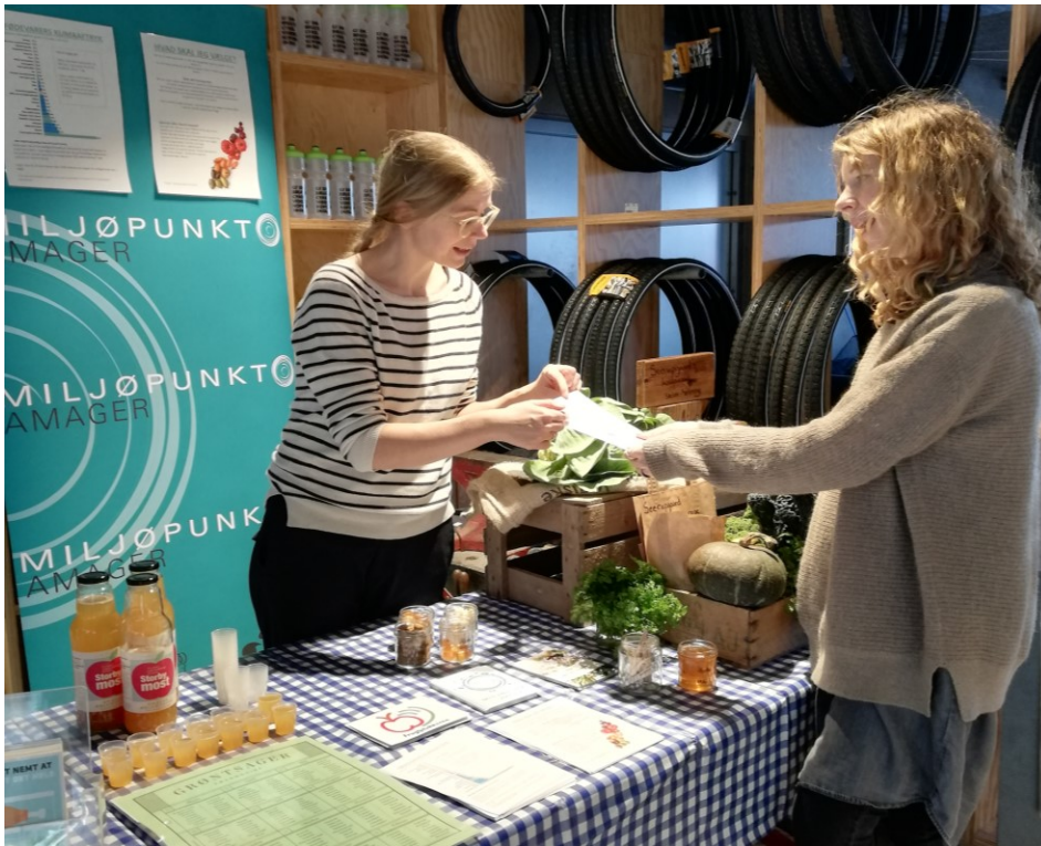
Julemarked på Kofoeds Skole

Markederne har været med til at skabe relationer mellem lokale fødevarerproducenter og køkkener med salg af bæredygtigt mad. Til særligt det første marked blev der udvekslet erfaringer og demonstreret produkter på tværs af de enkelte boder. Det netværk som Miljøpunkt Amager har opbygget i 2018 vil vi bruge aktivt videre i 2019 til at sætte fokus på lokale og bæredygtige madløsninger.