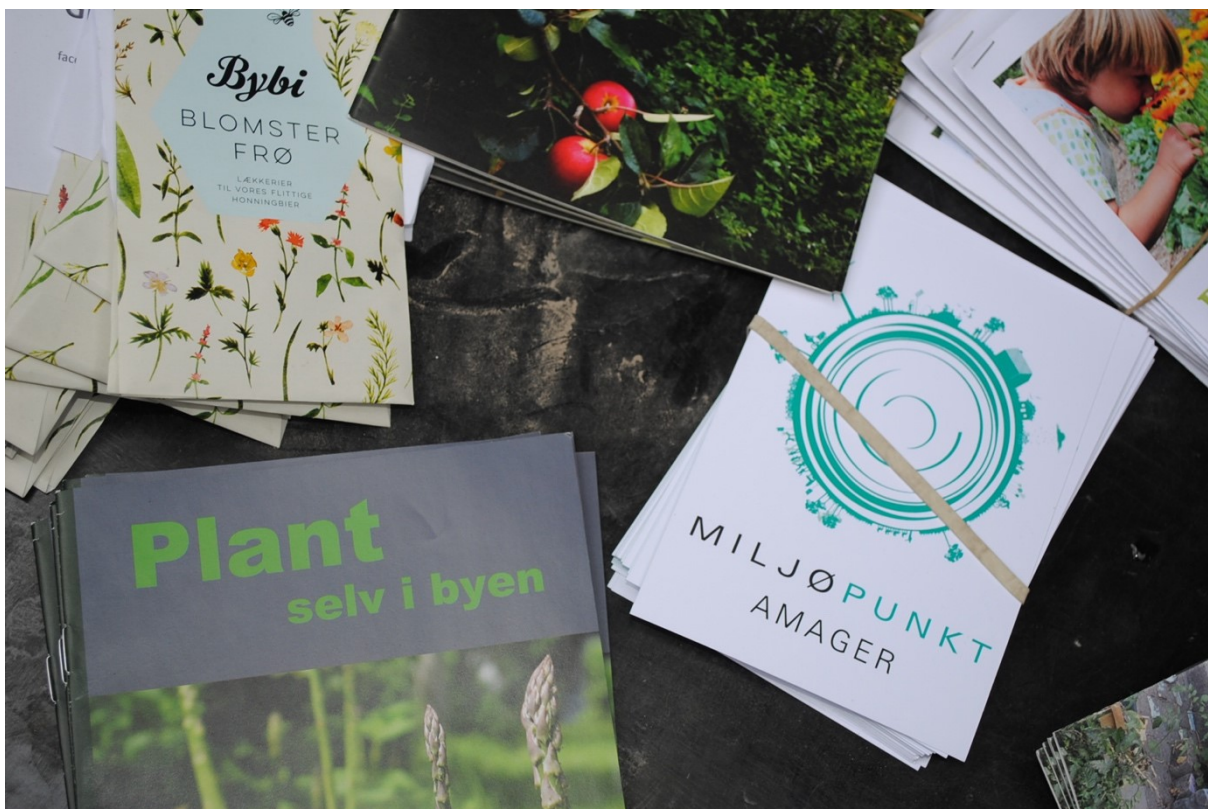
Inspirationsmaterialer til at gøre byen grønnere fra Plantekassedag i Kvarterhuset

I årsplanen for 2018 var det også et mål at tegne Amagers grønne profil endnu stærkere, bl.a. gennem at holde en nordisk konference med fokus på grøn byudvikling. Det lykkedes ikke at gennemføre konferencen i 2018. Ideen, erfaringerne og samarbejdspartnere tager vi med os i vores fremtidige planlægning. Til gengæld lykkedes det at arrangere en række erstatningsevents under titlen 'Vintergrøn' samt at afholde over 10 andre arrangementer der understreger det særlige grønne engagement på Amager.