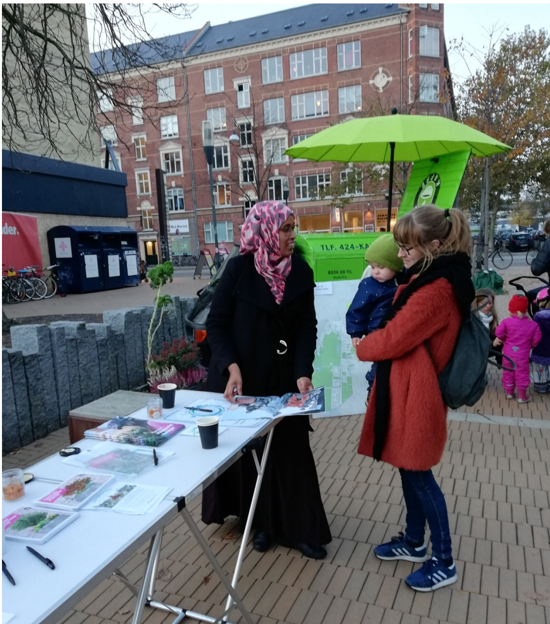
Park-dag på pladsen mellem Holmbladsgade og Bremensgade

Til begge park-dage blev der investeret i en kaffevogn, der uddelte gratis kaffe og det var en vellykket strategi, der fik deltagerne til at blive længere og engagere sig i emnet.