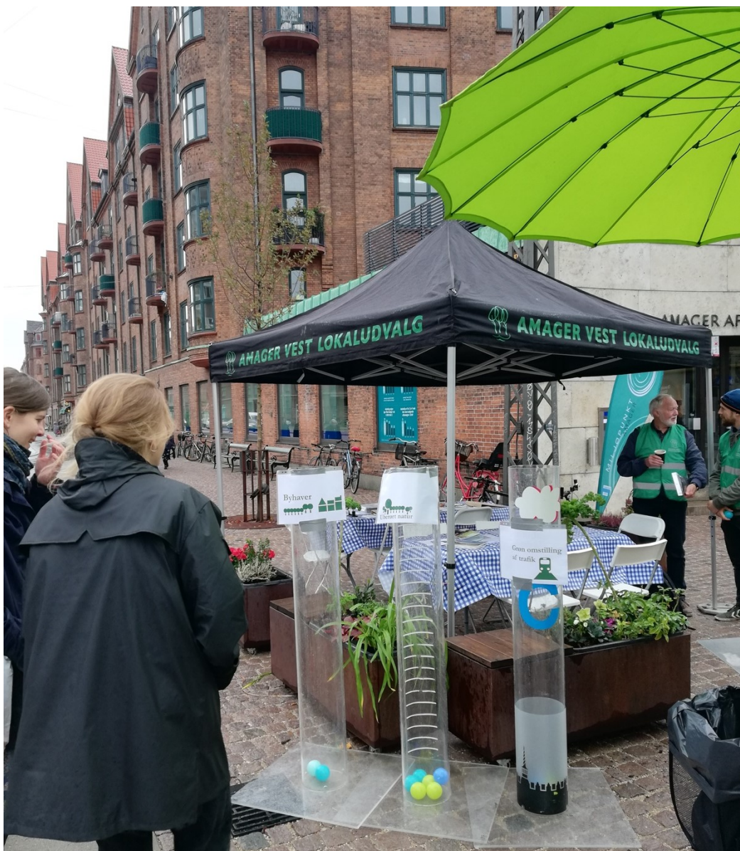
Park-dag på pladsen mellem Holmbladsgade og Bremensgade

Miljøpunkt Amager har i 2018 holdt to park-dage. Den 26. oktober arrangerede vi en park-dag på Amagerbrogade sammen med Amager Vest Lokaludvalg. Miljøpunkt Amager fortalte om hvordan man kan gøre Amager grønnere, samt lavede frøbomber. Vi havde også Lånehaverne med, som viste hvordan man hurtigt kan forvandle en grå plads til et grønnere område ved at bruge plantekasser. Amager Vest Lokaludvalg brugte arrangementet til at skabe dialog om kommunalplanstrategien og indbød borgerne til at prioritere, hvad de synes var vigtigt at fokusere på i forhold til byens grønne udvikling. Det var en god måde at indgå en dialog med borgerne på omkring byens fremtid. Dagen var en succes, og ca. 80 borgere mødte op til trods for store mængder regn i løbet af dagen.