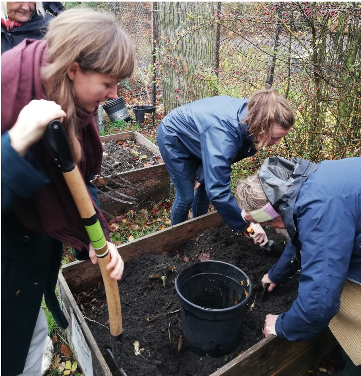
Workshoppen 'Vintergrøn 1' i UrbanPlanTen

De to workshops i 2019 sætter fokus på dyrkning, grønne mødesteder og sociale fællesskaber.