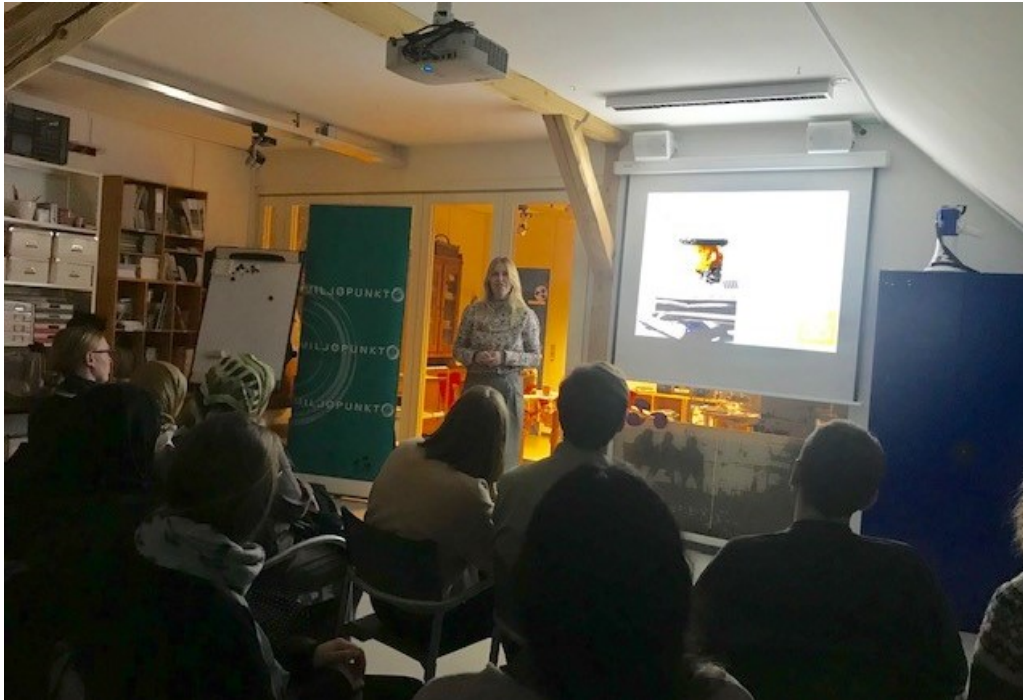
Foredrag med Sustain Daily om miljøbevidsthed i Kvarterhuset

Foredraget tog udgangspunkt i fem dele af hverdagslivet: Bolig, mad, tøj, ferie og skrald og drog paralleller til FN's verdensmål for bæredygtig udvikling.