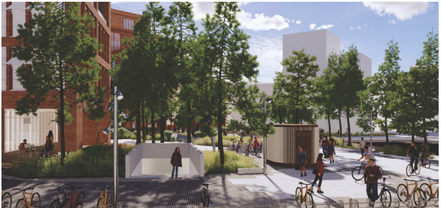
Arbejdernes Landsbank's visualisering af toilettet ved bitrappen: