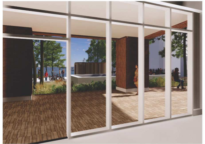
Kig fra AL-Huset/Bistro og terrasse, i retning mod Fordgraven

Toiletbygningen skal have en synlig placering, men denne placering vurderes at være for fremtrædende i forhold til pladsens udformning og udsigten fra /ankomsten til de omkringliggende bygninger. Placeringen blokerer sigtelinjen fra AL-Husets bistro/terrasse, i retning mod Fordgraven. Toilettet er desuden meget fremtrædende fra lejlighederne i P2.