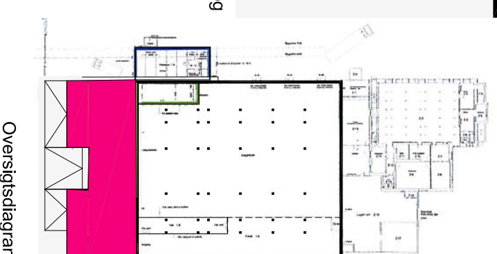
1. sal plan diagram