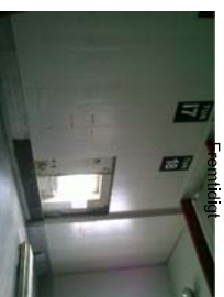
Eksisterende Kontor Fremtidige køkken