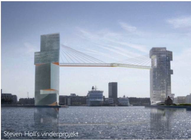
Steven Holl's vinderprojekt

60.000 m 2 til Steven Holl's vinderprojekt med højhuse og gang- og cykelforbindelse over havneløbet. Hertil kommer et ønske om at etablere parkering i konstruktion over terræn i størrelsesordenen 10.000 m 2 . Der etableres også parkeringskældre under hotel- og boligområderne, ligesom der etableres parkeringskældre under højhuset på Langelinie.