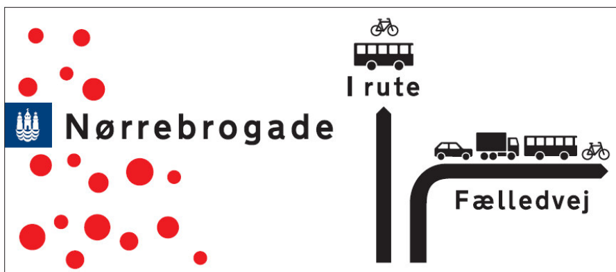
Eksempel på banner 6 x 1,5 meter