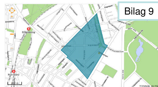
Område 45 Optalt oktober 2012