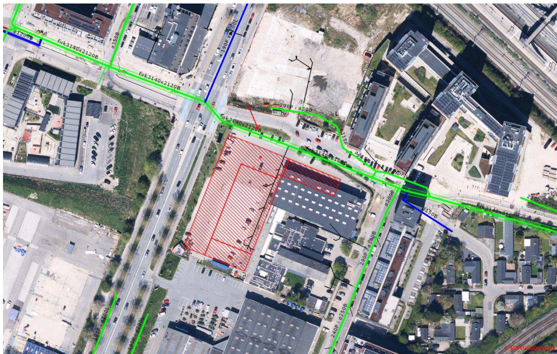
Kort 1 Gåsebækrenden