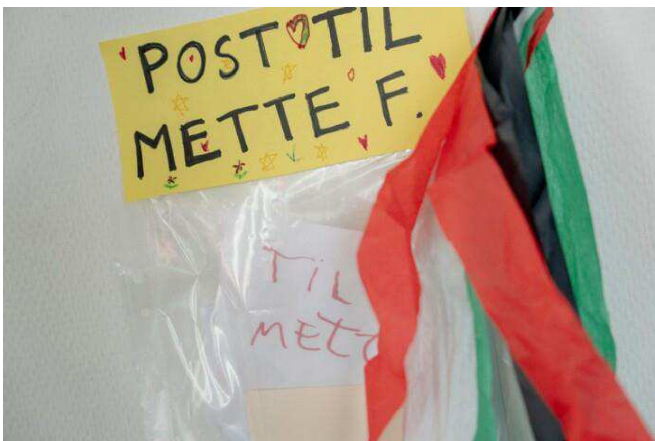
Børneblokken for Palæstina samler breve ind til statsminister Mette Frederiksen.

Derfor kan fredfyldte demonstrationer og aktiviteter, der giver børn en følelse af solidaritet og fællesskab omkring en situation, som fylder dem med bekymringer, give børn en oplevelse af et positivt fællesskab og håb.