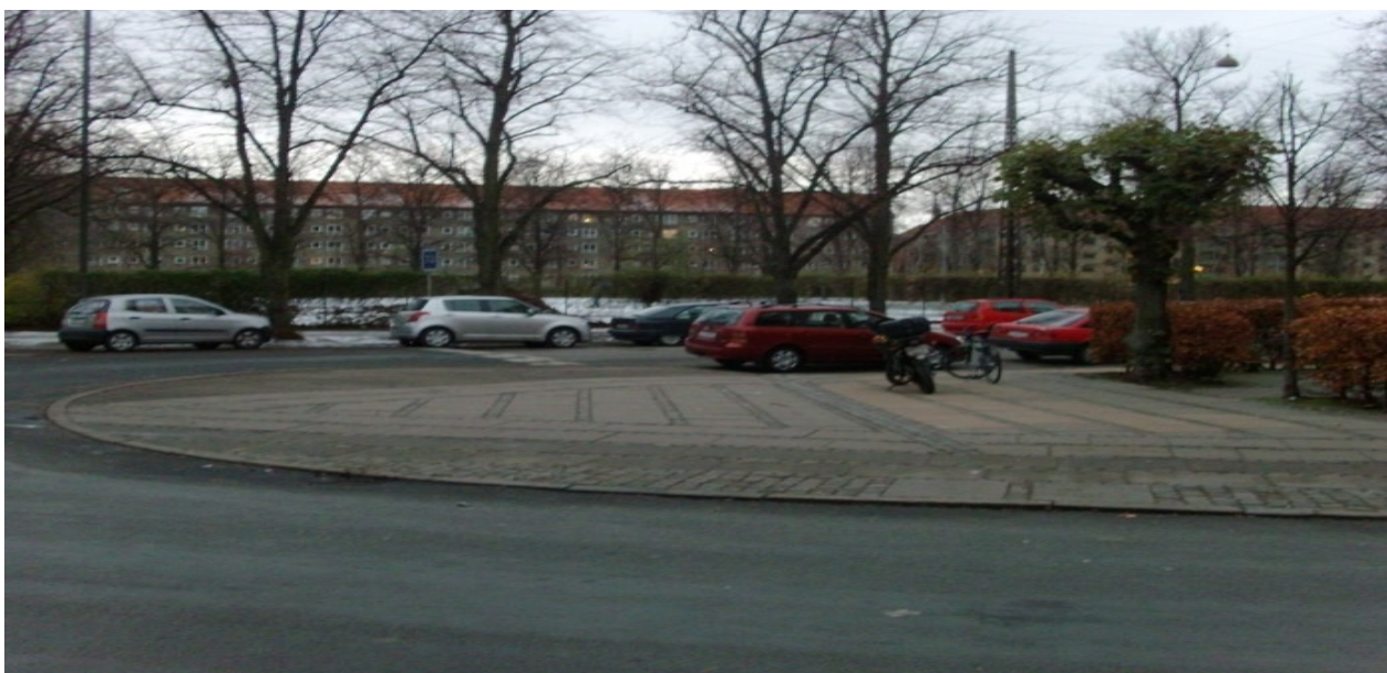
Krydset Stefansgade/Nordbanegade i dag