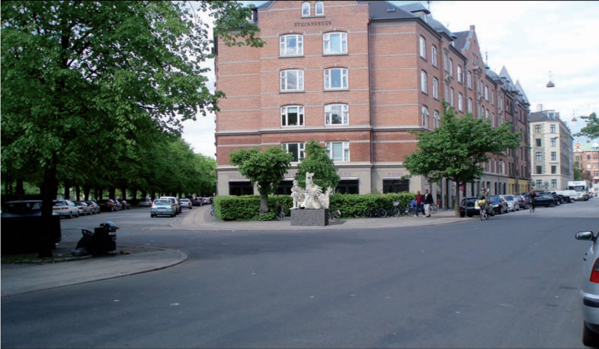
Visualisering set fra Stefansgade mod Stefanshus