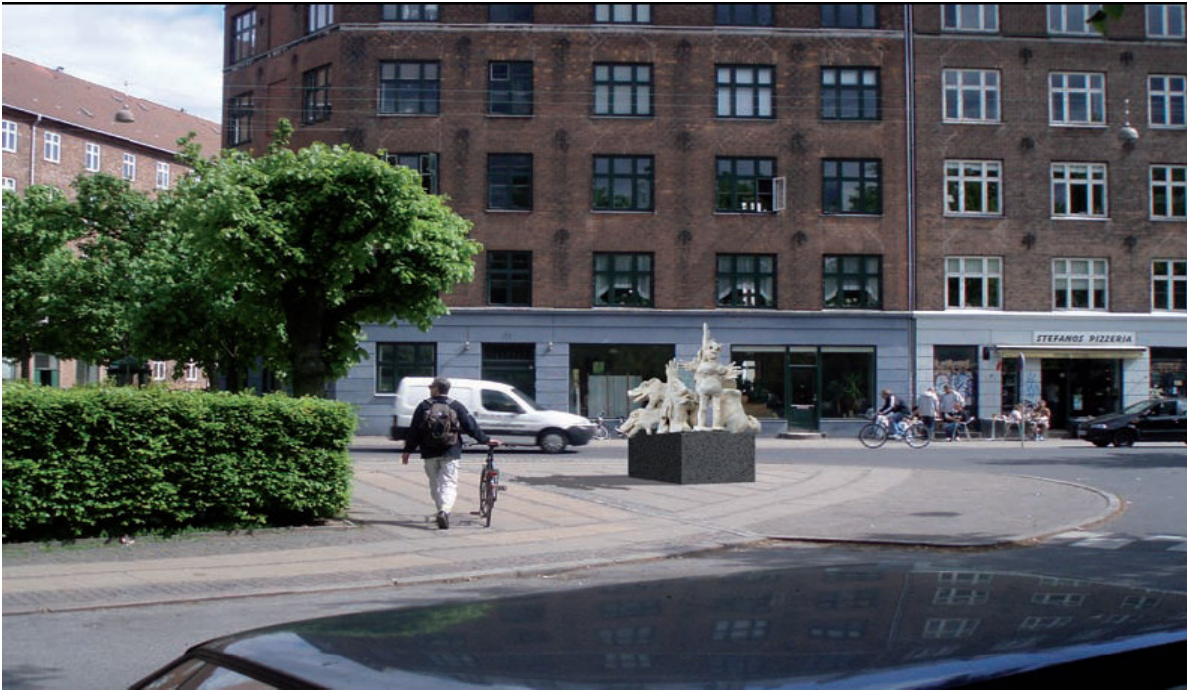
Visualisering af skulpturen set fra Nordbanegade mod Stefansgade