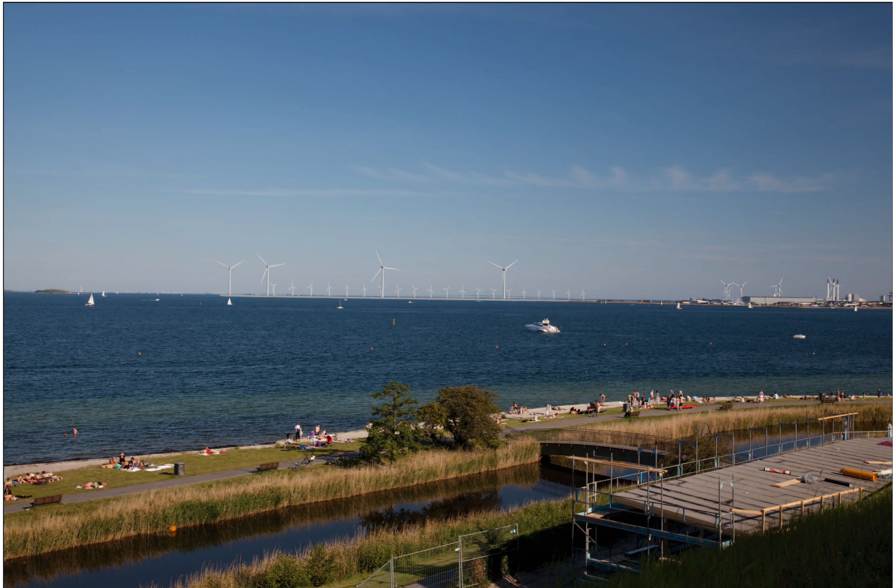
Visualisering 3 med fire vindmøller opstillet bag ny mole nordøst for Nordhavnen. Afstanden til nærmeste vindmølle er 3,2 km. Afstanden til vindmøllerne på Lynetten er mindst 5,7 km og til vindmøllerne på Prøvestenen mindst 8,6 km.