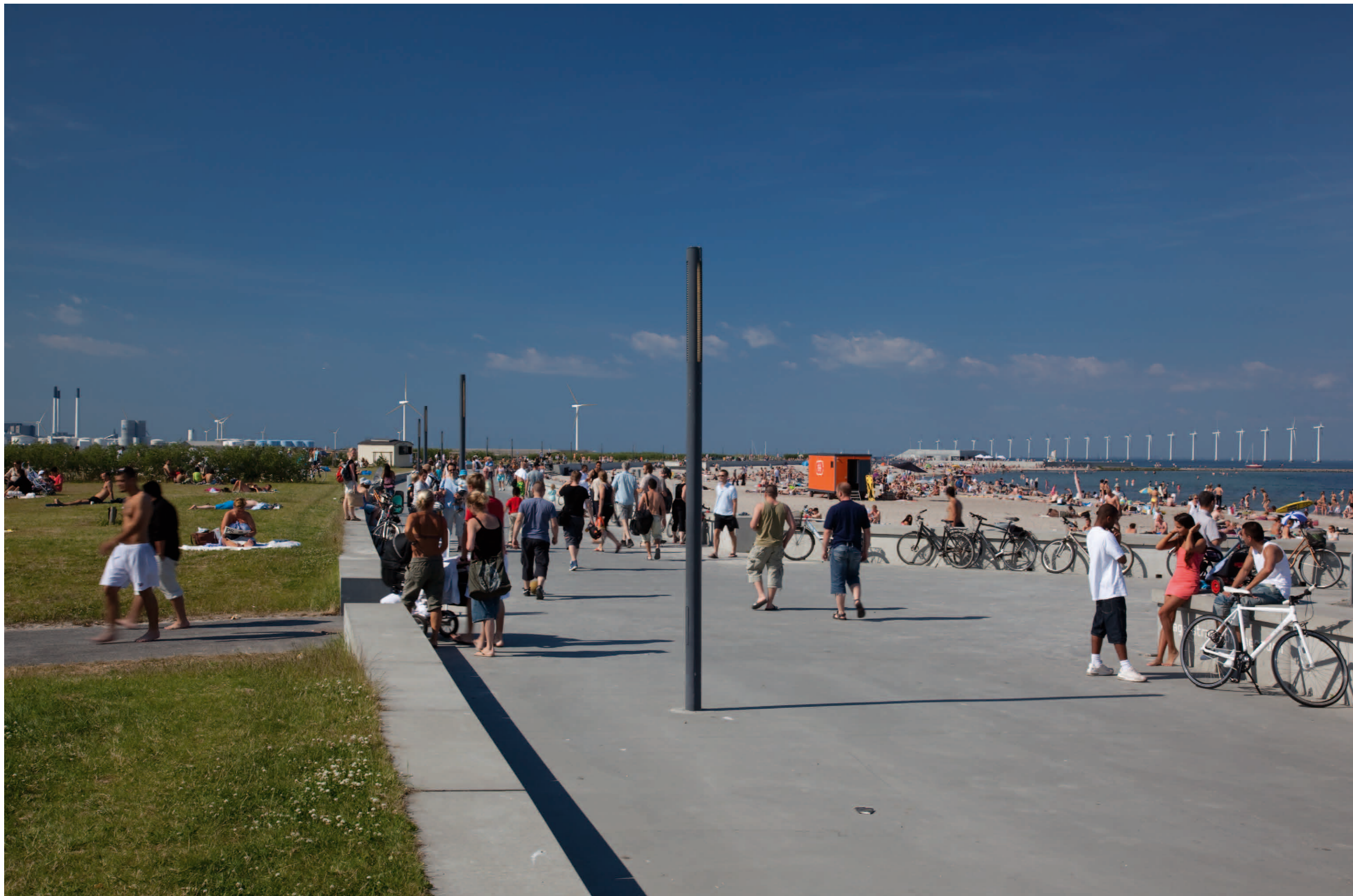
Visualisering 2 med to vindmøller opstillet ved Prøvestenen som de nærmeste. Afstanden til nærmeste vindmølle er 2,8 km. Afstanden til vindmøllerne på Lynetten, som ses til venstre, mindst 5,1 km og bag dem til Nordhavnen mindst 8,3 km.