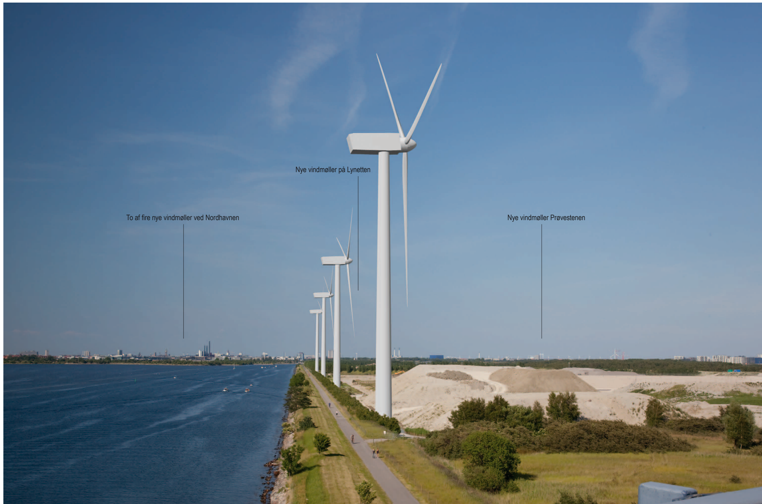
Visualisering 1 med de fire 149,9 meter høje vindmøller ved Kalvebod på nært hold. Afstanden til nærmeste nye vindmølle er cirka 300 m.