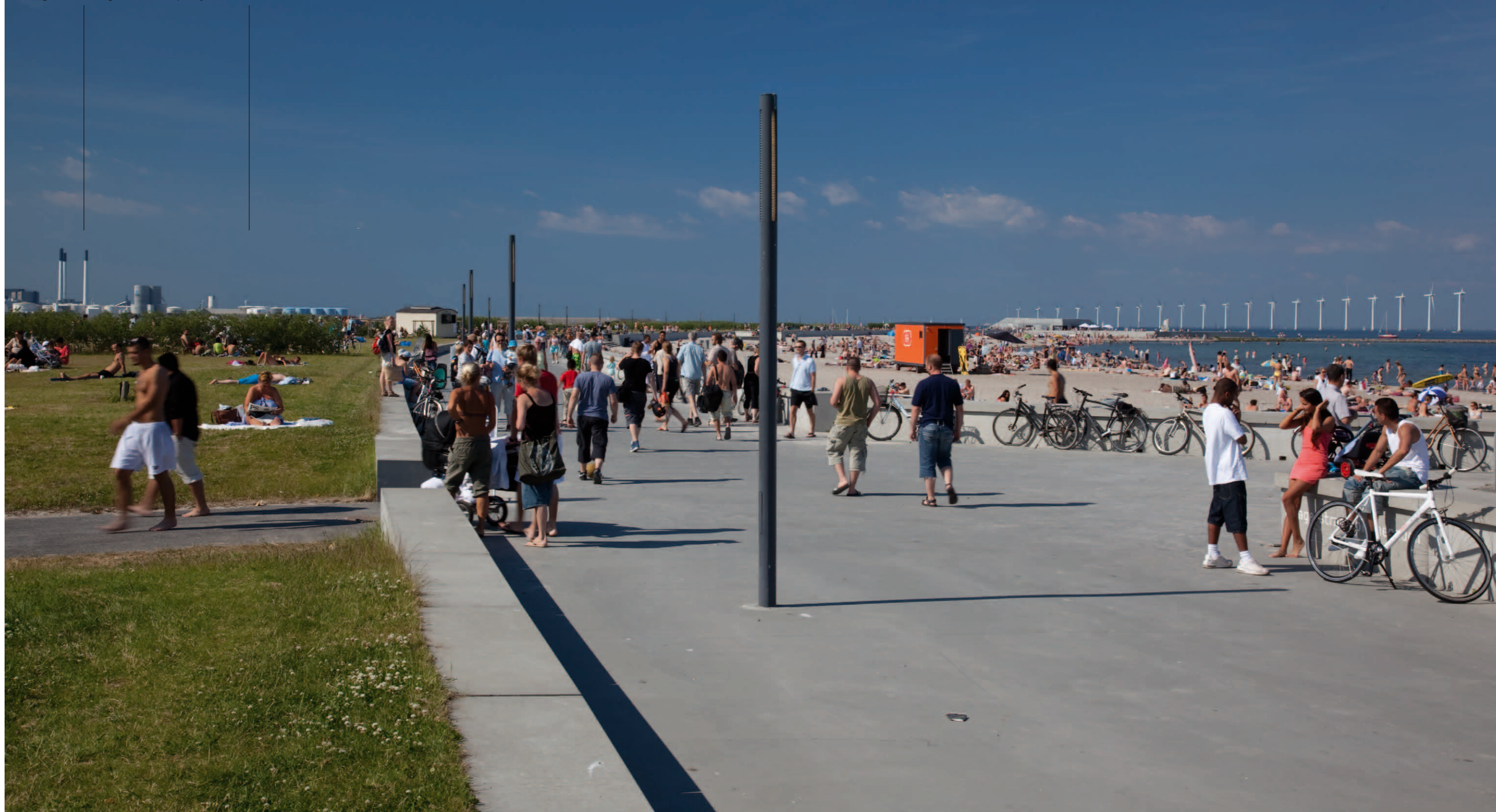
Fotopunkt 2. Den sydlige del af Amager Strandpark set mod nord med Middelgrundens vindmøller til højre og Prøvestenens oliebeholdere samt Amagerværket til venstre. Bag oliebeholderne ses de eksisterende vindmøller på Lynetten mindst 5,1 km borte.