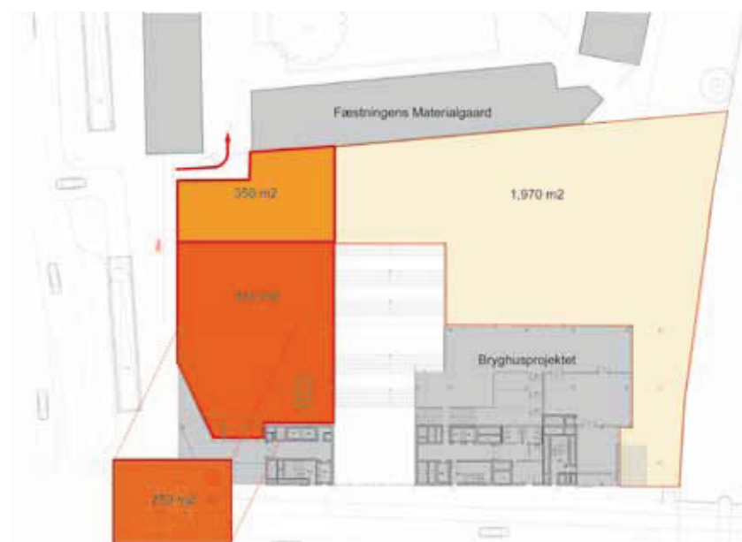
Større byplads med ét udvidet sikret område og fjernelse af legebakken.