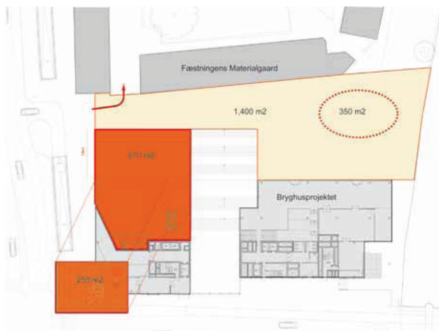
Sikret område og 'halvt sikret' legebakke som lokalplanforslaget.