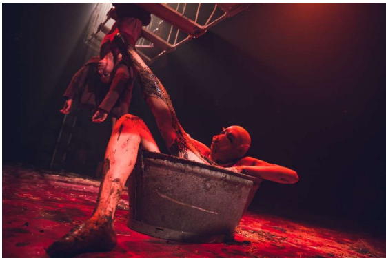
Den indre svinehund forfører og manipulerer i Uppercut Danseteaters danseforestilling 'Plejer er død'