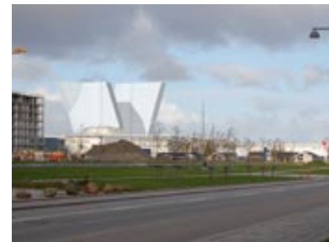
Hotellet fuldt udbygget set fra den sydlige del af Ørestads Boulevard.