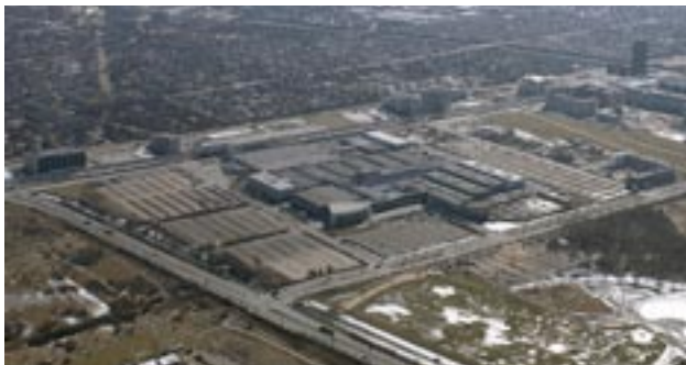
Luftfoto. Bella Center grænser op til Ørestad, hvor nybyggerier skyder op. (JW Luftfoto).

De to højhuse skal pege i hver sin retning for at give flest mulige værelser bedst mulig udsigt. De øverste etager slår et knæk - det sikrer udsyn til blandt andet city.