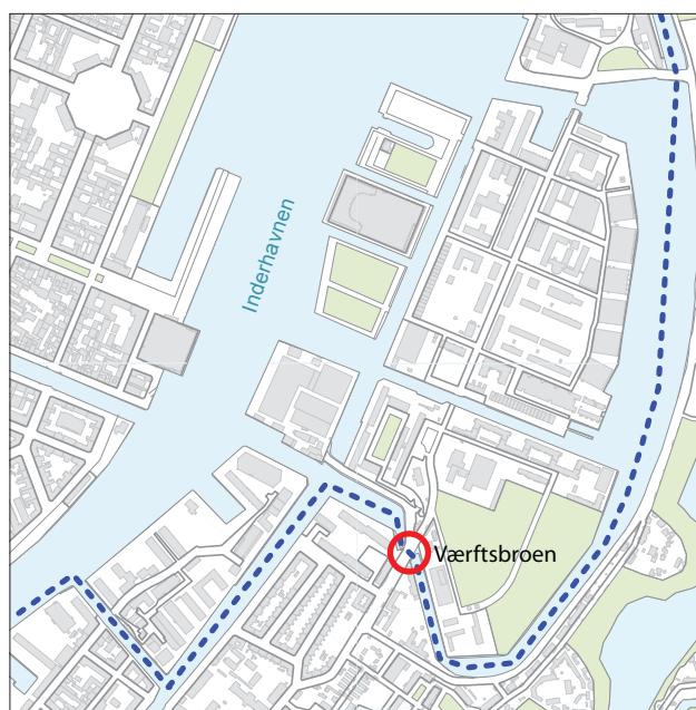
3. Den blå rute

Eventuelt anlæg af en cykelrute mellem Trangravsvej og Arsenaløen over Værftsbroen er ikke en del af dette bydelsplanprojekt. Udgifterne til cykelruten er derfor ikke taget med i overslaget over projektøkonomien.