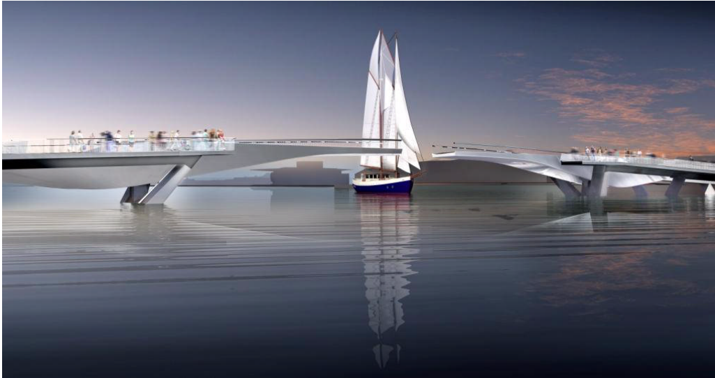
Broen set mod nord