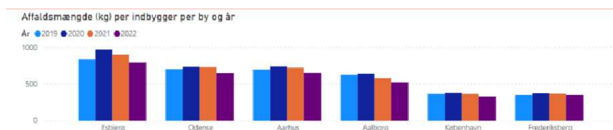
Figur 1. Total affaldsmængde, affaldsmængde per husstand og affaldsmængde per indbygger for årene 2019-2022, for de seks udvalgte byer. Data er hentet på Affaldsviden.dk.

Forslag: Vi mangler affaldstal på bydelsniveau i København. Det håber vi bliver en mulighed i planperioden, meget gerne helt ned til gårdniveau.