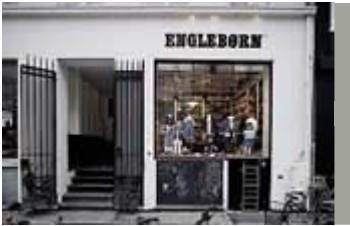
Enkel skiltning med malede bogstaver, Amagertorv 1.