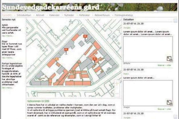
Ex på hjemmeside, her Sundevedsgade-karreem

Gårdrumsspillet vil have til huse på en hjemmeside oprettet specifikt for denne karré. Her kan borgerne få informationer og debattere vedr. anlæggelsen af det nye gårdanlæg. Via et brugervenligt, interaktivt 3d-værktøj har borgerne endvidere mulighed for at komme med forslag til det kommende gårdanlæg samt opleve, hvordan det vil komme til at se ud i 3 dimensioner. På alle tidspunkter i processen kan beboerne debattere egne og andres forslag og synspunkter - med mulighed for bidrag fra eksempelvis landskabsarkitekt og øvrige eksterne parter.