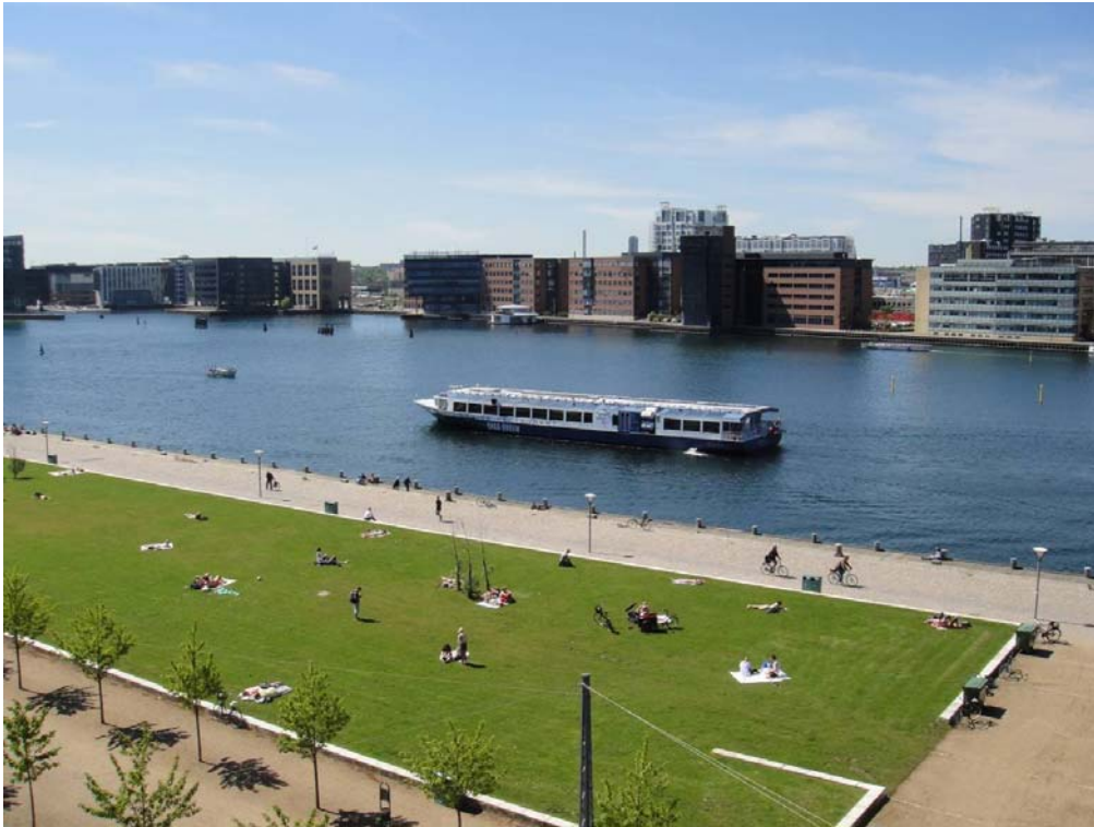
Saga Queen, restaurant- og konference-båd ud for Islands Brygge