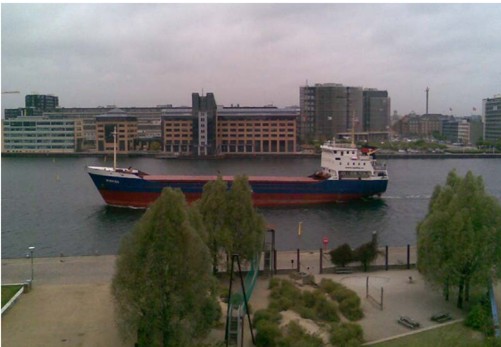
Stor coaster lige ud for Islands Brygge