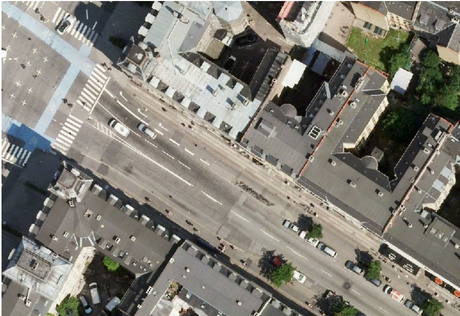
Frederiksborggade øst for Søtorvet. I retning mod byen kan der på de første ca. 30 m. frem til træerne optegnes en 3 m bred cykelsti, der langsom indskrænkes tilden eksisterende ca. 2,5 m brede sti.