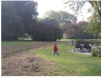
Parkerne bruges blandt andet af dagplejemødre, som udnytter mulighederne for at komme tæt på natur og legeområder.