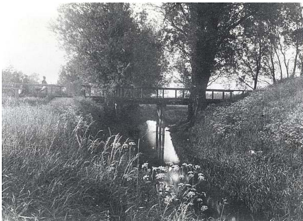
Bro over Harrestrup Å ved Dæmningen som det så ud i 1920.

Grøndalsparken blev anlagt i tre tempi. Stykket fra Borups Allé til Godthåbsvej blev udført i 1930, stykket herfra og til Jernbane Allé i 1933, mens det sidste stykke til Ålekistevej fulgte i 1939. I 1953 blev den åbne del af Grøndals Å tildækket.