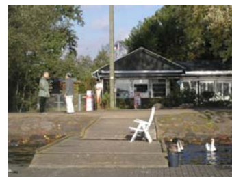
Kiosken Damhuskanten, som ligger i sydligste hjørne af Damhusengen.

Samspillet mellem overfladevand og grundvand er komplekst. I nogle områder vil en overudnyttelse af grundvandet kunne have en negativ indvirkning på overfladevandet i f.eks. søer og vandløb eller påvirke tilstanden af vådområder kraftigt. Det medfører, at tilstanden bliver ændret, hvilket i nogle tilfælde kan forringe områdets biologiske og rekre-