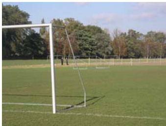
Der finder mange aktiviteter sted i parkerne. Der spilles bold, leges, grilles, dyrkes motion, kigges på planter og dyr, solbades med mere.