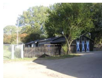
Sejlkлубben ”Damhussøen” ved Damhussøen.