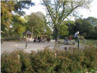
Nabokvarterernes børn i alle aldre har stor gavn af legearealerne i parkerne.