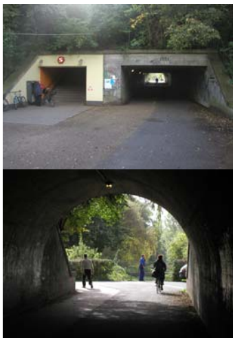
Tunnelen under jernbanen i Vigerslevparken ved Hvidovre Station.

På baggrund af henvendelsen rejste Naturfredningsnævnet for København d. 14. feb. 1959 fredningssag for en lang række københavnske parker med den såkaldte ”rejsningskrivelse”. Den 13. juni 1963 tiltrådte Københavns Borgerrepræsentation en aftale med Fredningsnævnet om, at kommunen efter forhandling med nævnet skulle udarbejde fredningsdeklARATIONER for alle de parker, der var nævnt i rejsningskrivelsen og bagefter foretage tinglysning af deklARATIONERNE. Alle parkerne i nærværende fredningsforslag var omfattet af aftalen.