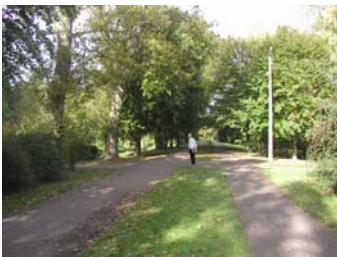
Parkernes gennemgående stier tilbyder en grøn og trafikssikker rute for både cyklende og gående.