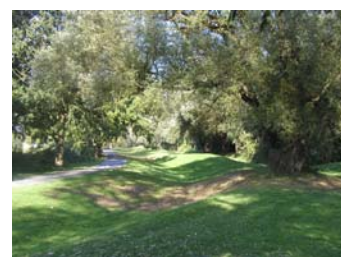
Herunder ses et stemningsbillede fra Krogebjergparken.