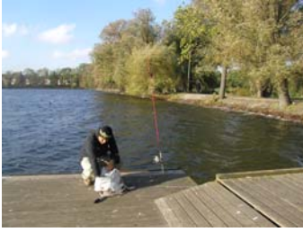
Damhussøen, med sin rolige flade, ligger som en stille oase i en ellers travl by.