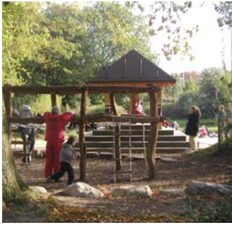
Parkernes legepladser er meget populære. Her ses et billede af soltemplet i Grøndalsparken.

I øjeblikket er optimistjollesejls tilladt på den nordlige del af Damhussøen. Ligeledes foretages miljøundersøgelser og skolebørn sejles ud på søen i forbindelse med undervisning om vand med mere. Dette vil ikke hindres af fredningsforslaget.