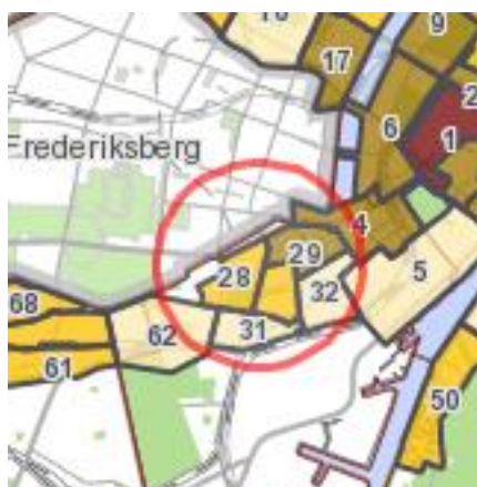
Tællinger med belægningsprocenter, Dagens situation