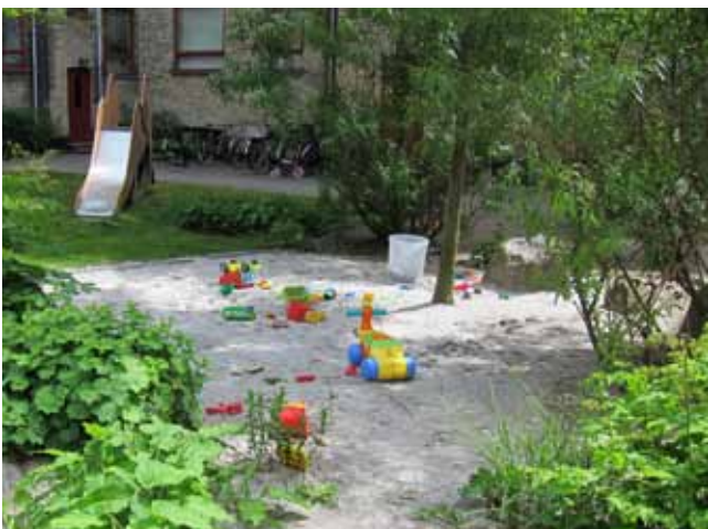
Foto af fremtidige forhold til inspiration