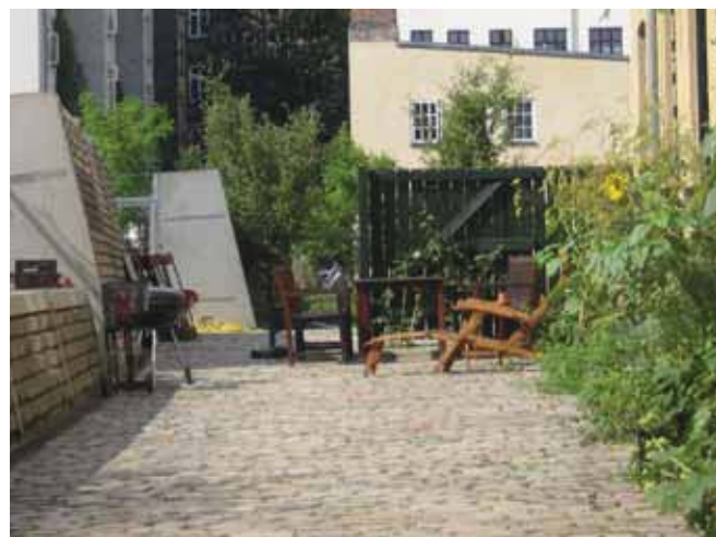
Foto af fremtidige forhold til inspiration