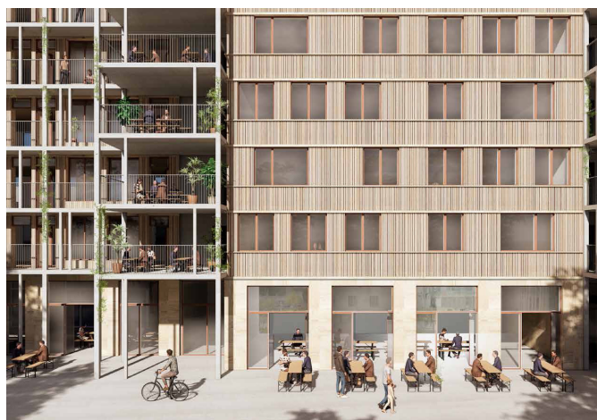
Illustration af opholdsaltaner og fælleslokalerne i stuen

Der er indgået en betinget grundkøbsaftale mellem Boligforeningen 3B og By & Havn