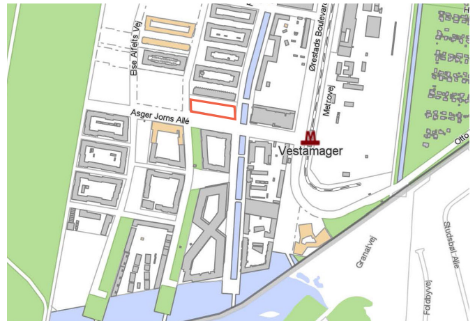
Kort med projektets placering

Projektet indeholder 90 familieboliger, heraf er 34 som seniorbofællesskaber og 10 som små familieboliger til boligsocial anvisning. Herudover indeholder bebyggelsen 32 ungdomsboliger, heraf 4 som små billige ungdomsboliger til boligsocial anvisning.