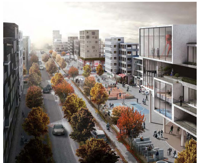
Visualisering af Asger Jorns Allé