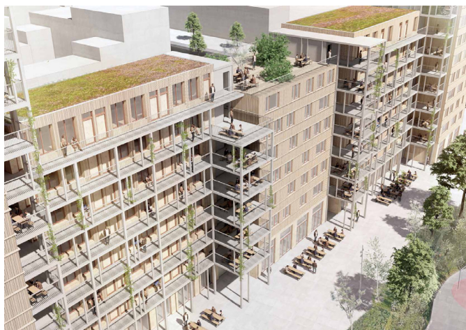
Illustration af de grønne tage og tagterrassen

Bebyggelsens stueetage er udlagt til flere udadvendte fællesrum med faciliteter som fællesspisning, vaskeri, værksted, byttebørs, arbejdsfællesskab, studiepladser og hjemmearbejdspladser.