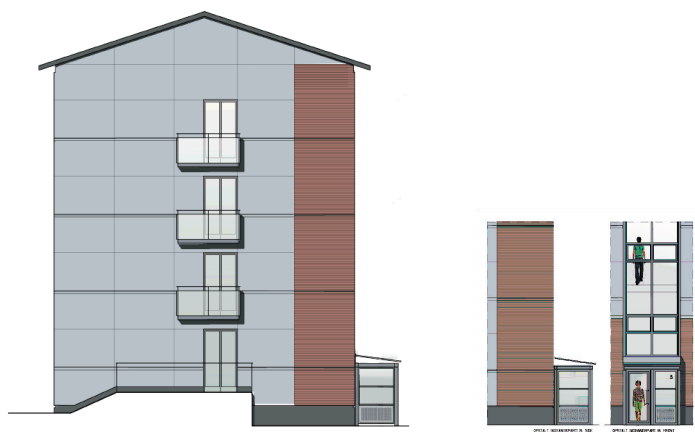
Fremtidige forhold sydgavl og nyt indgangsparti