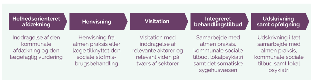
Figur 1: Samarbejde og koordination i forløbet

Nedenstående figur illustrerer samarbejdsfladerne på tværs af sektorer undervejs i forløbet fra henvisning til visitation og koordinering før, under og efter det integrerede forløb.