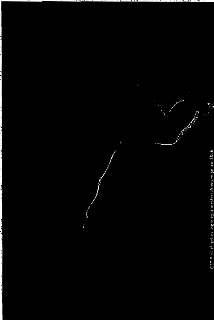
CE - Børn, Ungdom og Familieforvaltningen, januar 2006