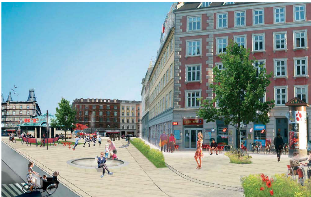
Illustrationstekst: Forslag til udformning af Trianglen. Camilla Handberg, Arkitekt maa.