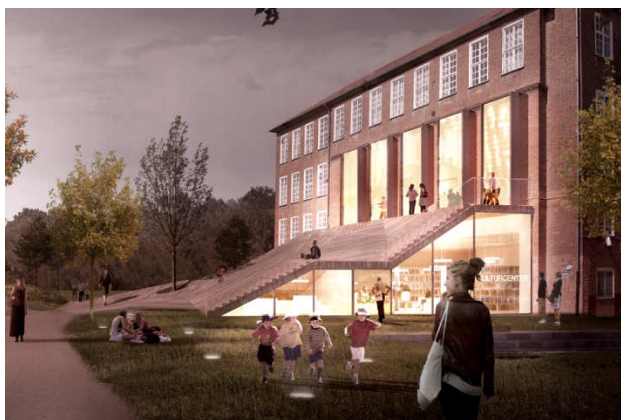
Illustrationstekst: Vision for udformning af Kulturcenter. Udarbejdet af Tredje Natur.

Dette afhænger i høj grad af hvordan kulturcenteret organiseres.