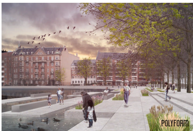
Illustrationstekst: Forslag til trappeanlæg ved søerne. Udarbejdet af POLYFORM.