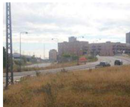
Området set fra Vigerslev Allé med Retortvej og med den nye bebyggelse på Grønttorvsområdet i baggrunden.

Området, der ligger i Valby, var tidligere domineret af Valby Gasværk, der lå på sydsiden af Vigerslev Allé med jernbanespor til kulforsyning gennem den aktuelle ejendom og videre til gasværket via en bro over Retortvej. Resten af ejendommen blev udnyttet til kolonihaver. Kvarteret omkring gasværksgrunden består af