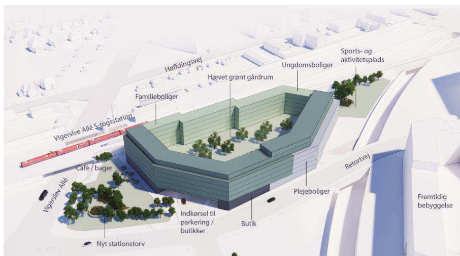
[Visualisering, der viser et eksempel på nybyggeri.] Illustration: Arkitema.

Bygherre har anmodet om en udbygningsaftale for Retortvej, der vil omhandle etablering af et signalreguleret kryds og en udvidelse af vejen med svingbaner frem til krydset ved Vigerslev Allé.