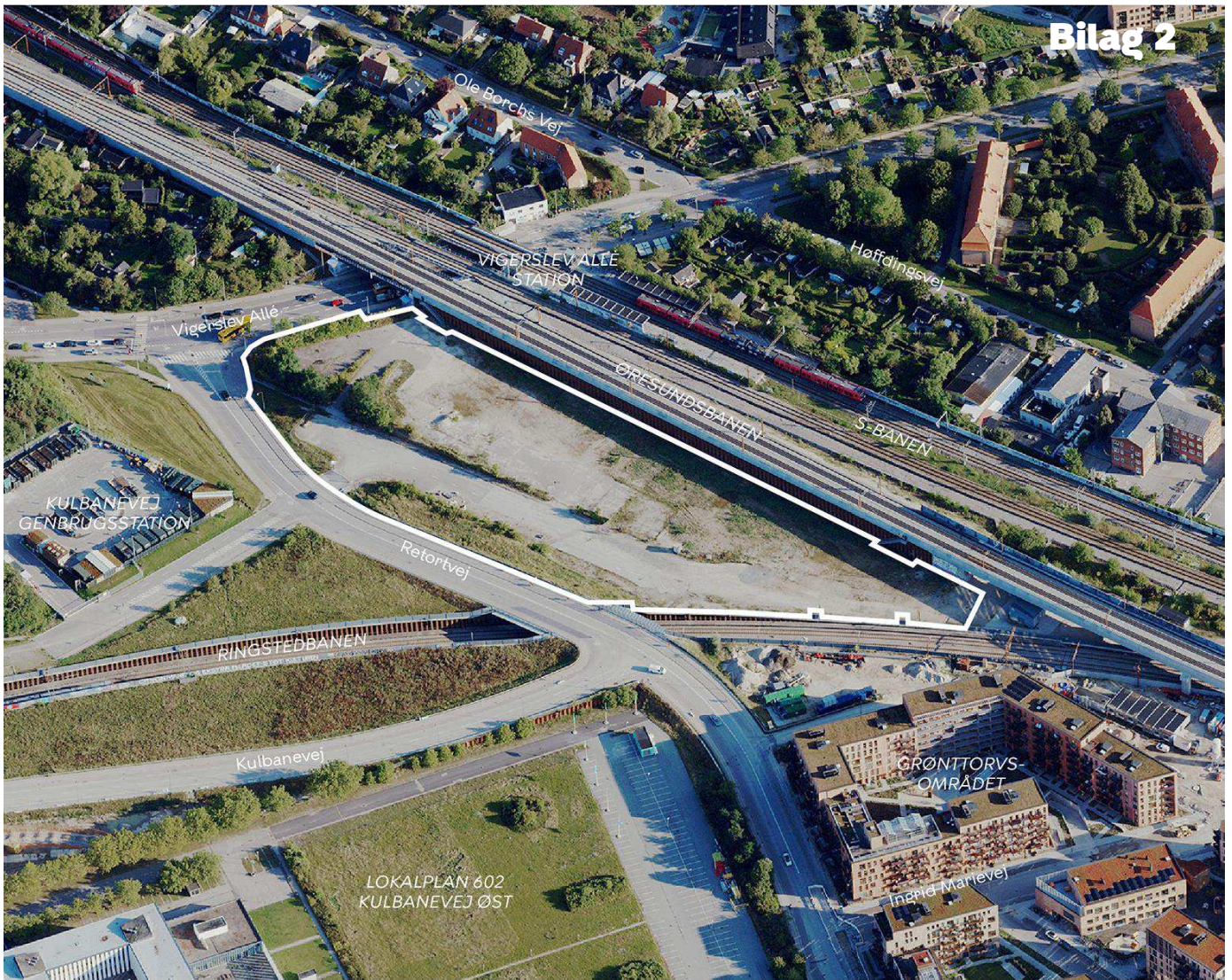
Området set mod nord. Lokalplanområdet er indtegnet med hvid linje, og de vigtigste gader og bygninger m.v. er navngivet.