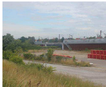
Området set fra Retortvej med jernbanen, støjskærm og broen over Vigerslev Allé i baggrunden.