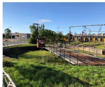
Drejeskiven, indgangen til området og de 'gule porte' i baggrunden.