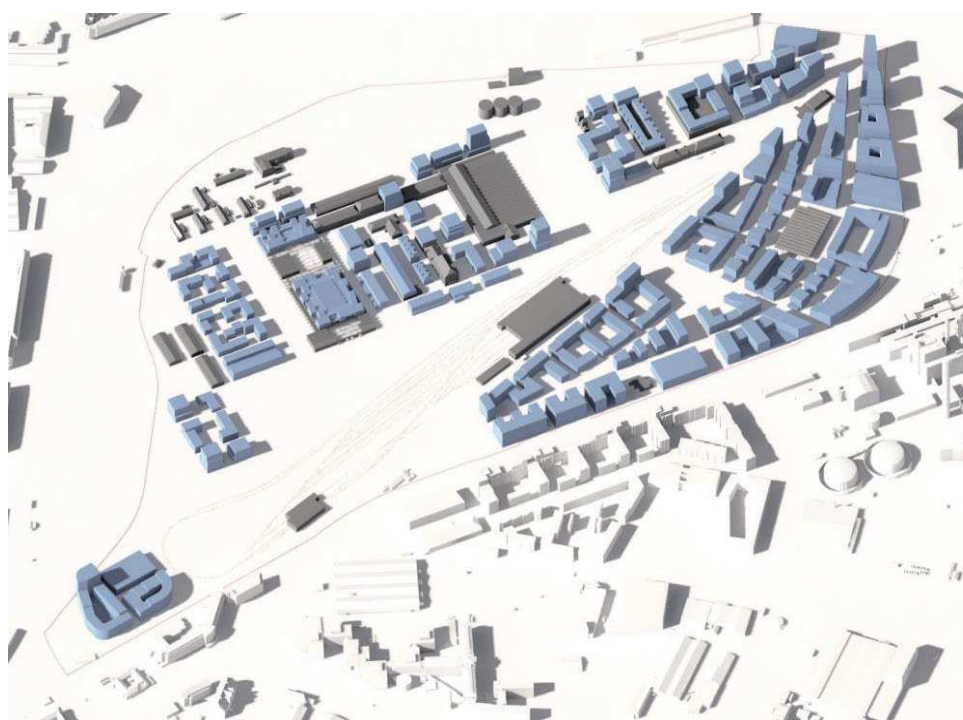
Foreløbig volumenmodel af bygherres forslag til bebyggelsesplan. Blå bygninger er nye og grå er eksisterende. Illustration: Team Cobe

Slots- og Kulturstyrelsen har udpeget en del af området til det nationale industriminde 'Jernbanen mellem København og Korsør'. Området er også udpeget som samlet værdifuldt kulturmiljø i Kommuneplan 2019 med bebyggelser af særlig kvalitet og med et bevaringsværdigt helhedspræg. Det betyder, at opførelse af