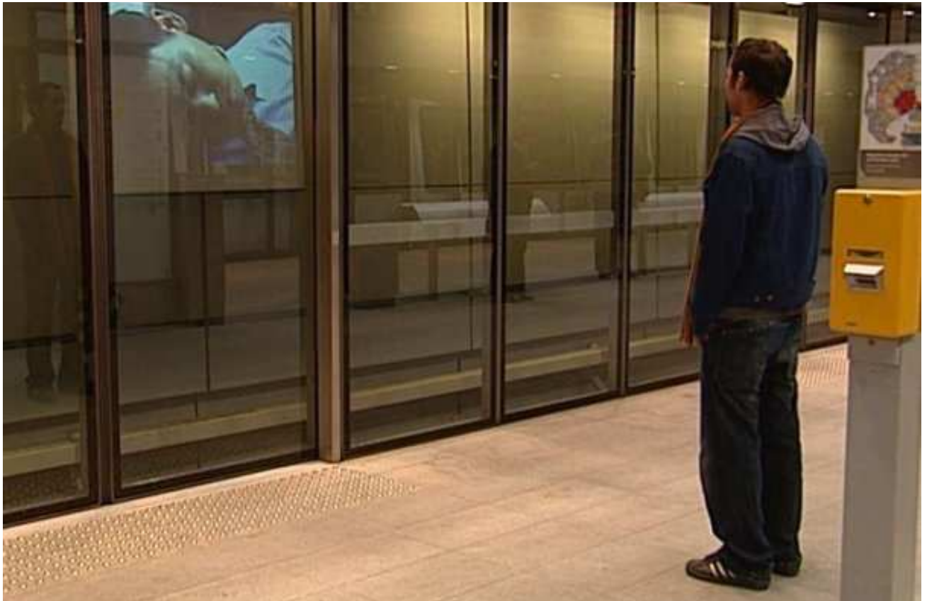
Tokyo Underground by Simon Lereng Wilmont ( Winner of 60seconds 2006) at Københavns Metro perron.