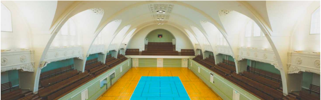
Idrætshusets store sal