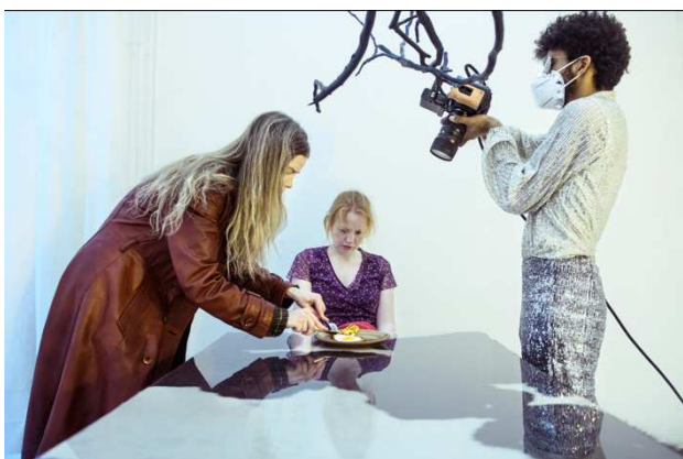
Luna Secunda, Reumertvindende digital forestilling 2021