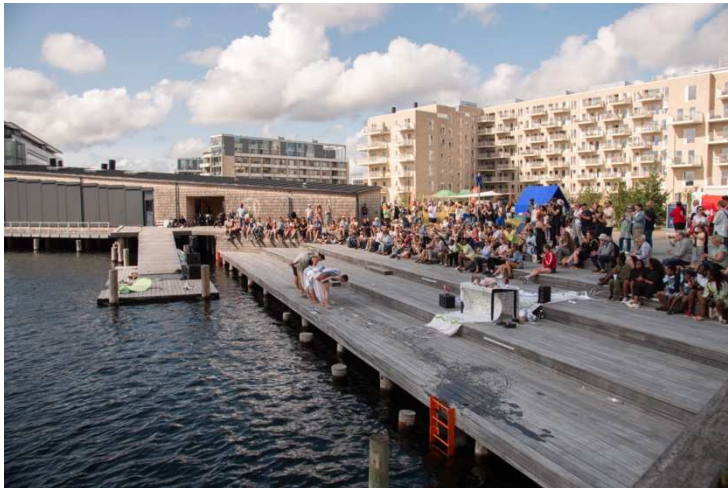
Forestilling i Holmekvarteret, arrangeret af Sydhavns Teaters udviklingsinitiativ ST:ART, med Kunstnergruppen Dyveke/SPRING danseteater.

KIN Festivalen er dybt forankret i bæredygtighed, høj kunstnerisk kvalitet og lokalt engagement. Med festivalen stræber vi efter at skabe et event med stor synlighed for alle Københavns borgere, som er pionerende inden for bæredygtig scenekunst. Festivalen skal være tilgængelig for alle, hvilket vi vil sikre gennem samarbejde med lokale foreninger og organisationer samt ved at integrere nogle af festivalens events i byrummet, hvor de er gratis at opleve. De enkelte forestillinger vil have specifikke målgrupper, hvor vi sikrer, at nogle er rettet mod familier med mindre børn, andre mod unge, voksne og ældre. Formålet er, at vi gennem kunsten skaber en positiv indflydelse på vores lokalsamfund, både ved at italesætte og konkretisere bæredygtighedsdagsordenen på nye måder, men også ved at styrke sociale relationer og skabe nye fællesskaber.