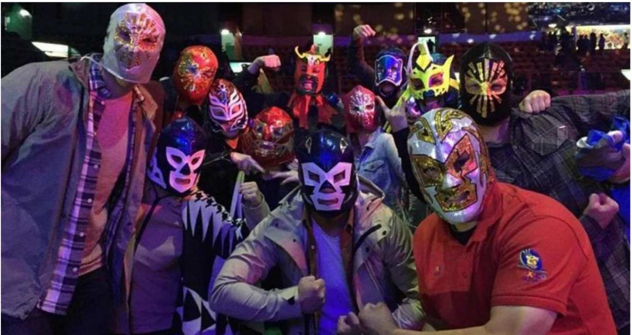
Lucha Libre turnering

Festivalen er unik ved at henvende sig til alle aldre, fordi værkerne inddrager folk aktivt. Kunstnerne er selv til stede og koreograferer cyklister i optog; underviser i en dans udviklet fra kropssprog i fodbold og fankultur; eller skaber masker og kostumer til en fælles Lucha Libre turnering, den mexicanske folkefest, der er lige dele show og brydning.