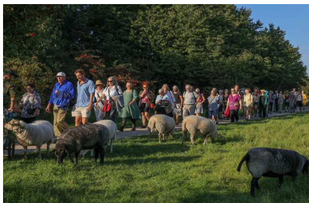
Fra forestillingen "Stien til Sydbjerget" udviklet i samarbejde mellem Naturplejegruppen og Sydhavn Teater

Bæredygtighed betyder i KIN-festivalens perspektiv også relationen til vores lokale omgivelser. Sydhavn er en bydel præget af opdelinger mellem de "nye" og de "gamle" kvarterer, som er yderligere forstærket af geografiske skel og store socioøkonomiske forskelle. Vi tror på, og har mange års erfaring med, at kunst i byrummet kan gøre en forskel, for det enkelte menneske og for bydelen som helhed. Kunst er en forandringsagent, der kan være med til at forene samfundet og styrke følelsen af tilhørsforhold og samhørighed. Derfor stræber vi efter at engagere og forankre festivalen lokalt, ved at præsentere stedsspecifikke forestillinger og samarbejde tæt med lokale foreninger og grupper. Ved at inddrage