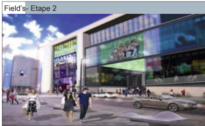
Illustration fra Field's

Steen & Strøm Danmarks vision for Field's er baseret på visionerne i Daniel Libeskind's masterplan for Ørestad City, som blev udarbejdet i 2006.