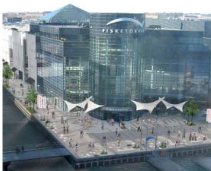
Illustration af Fisketorvets udgang mod havnepromenaden

Unibail-Rodamco har indsendt en ansøgning om en ombygning og fornyelse af Fisketorvet Shopping Center: